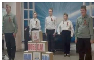
Юные краеведы, городской фестиваль