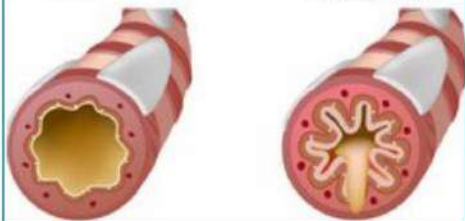
Суженные бронхи с мокротой

Не занимайтесь самолечением! При наличии симптомов обратитесь за консультацией к специалистам!