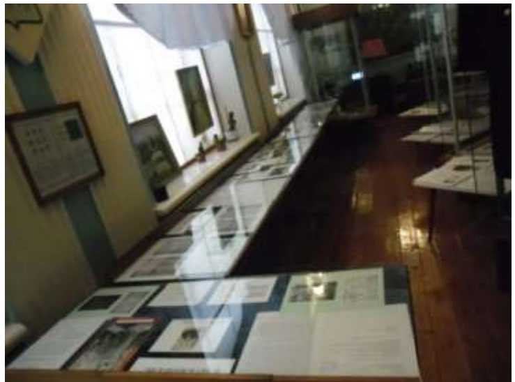
Фото 15. Экспозиции «Старинный Богородицк, ты мне дорог...» и «Он вчера не вернулся из боя».

Наш Дворец-музей является центром города пяти улиц, расходящихся веером из геометрических центров дворцовых – овального зала и бельведера.