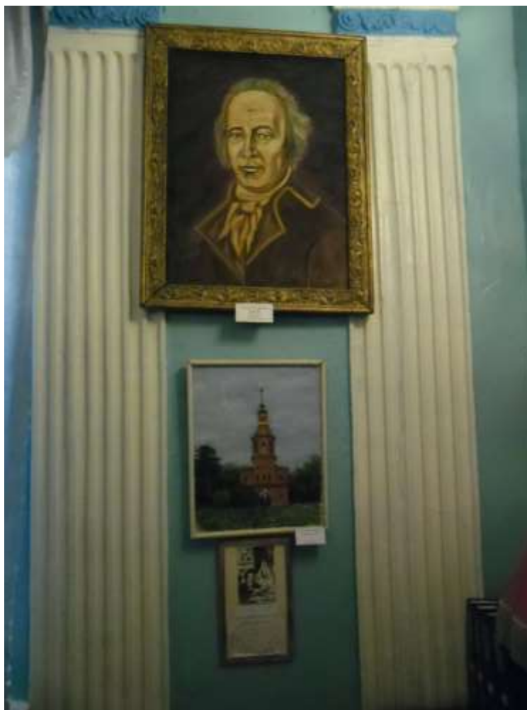
Фото 13. (Вверху) Портрет А.Т.Болотова. Масло. Холст. Предположительно Потапов В. И. (В центре) Въездная башня-колокольня. Масло. Холст. Коростылев И. А. (Внизу) Болотов в рабочем кабинете в Богородицке. План Богородицка.

В 1776 году управителем Богородицкой волости был назначен Андрей Тимофеевич Болотов. Здесь он создал живописный парк – «чудо здешнего края». Было это в 1784-1785 гг. В своих мемуарах «Жизнь и приключения Андрея Болотова, описанные самим им для своих потомков» автор пишет, что именно он начертил собственной рукой в 1778 проект застройки города.