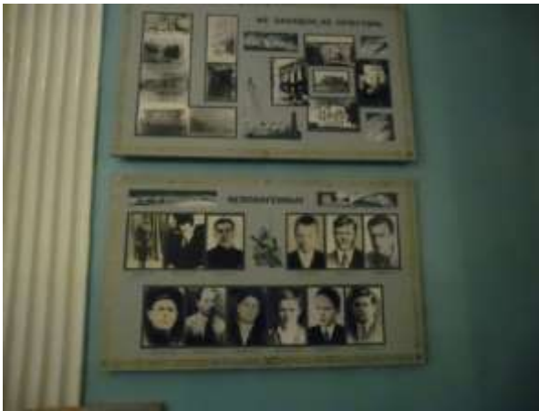
Фото 18. Экспозиции «Не забудем, не простим», «Непокоренные».