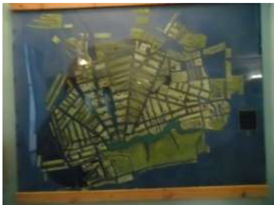
Фото 29. Схема города Богородицка в 60-ые годы XX века.