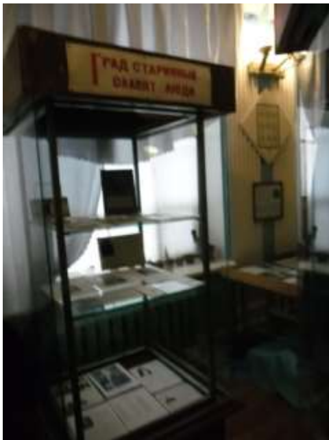
Фото 14. Экспозиция «Град старинный Славят люди».

Вторым своим рождением наш Богородицк обязан двум гениям архитектору Ивану Егоровичу Старову и Андрею Тимофеевичу Болотову, а также указу Екатерины II в 1777 году о переименовании сельца Богородицкого в город.