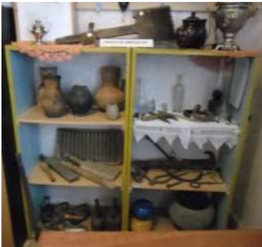
Фото 34. Экспозиция «Чердачная археология».

Широко представлено использование дерева в быту – прялка, донце, веретено, рубели, вальки, ложки, коромысло, лопата для хлебов, пестик для растирания в ступе зерна, стиральная доска.