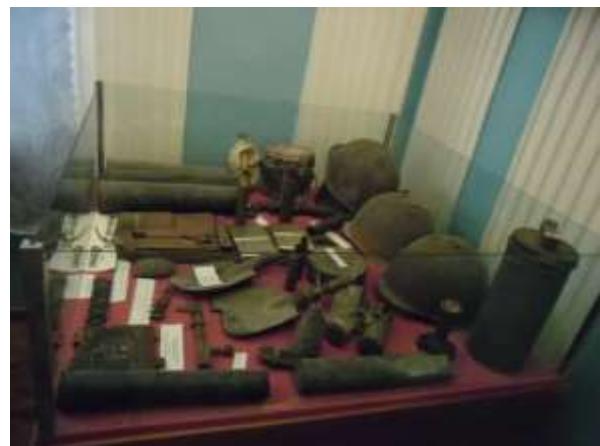
Фото 20, 21. Витрины экспозиции «Железное эхо войны».