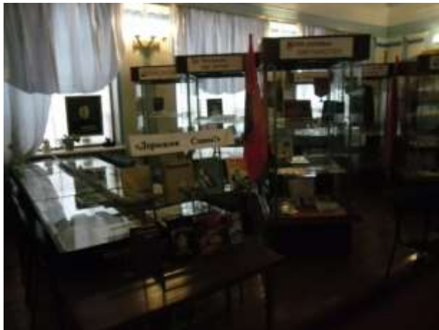
Фото 24. Экспозиции «Место службы Афганистан», «Эхо Чернобыля еще звучит» и «Герои земли Богородицкой».

Поле русской славы - Куликовское поле питало своей живительной силой всех, кому довелось выполнять свой воинский долг в Великой Отечественной войне, в Афганистане и Чечне, тех, кто добровольцами ушли на ликвидацию последствий аварии на Чернобыльской АЭС, кто добывал в шахтах черное золото – уголь. (Фото 24, 25)