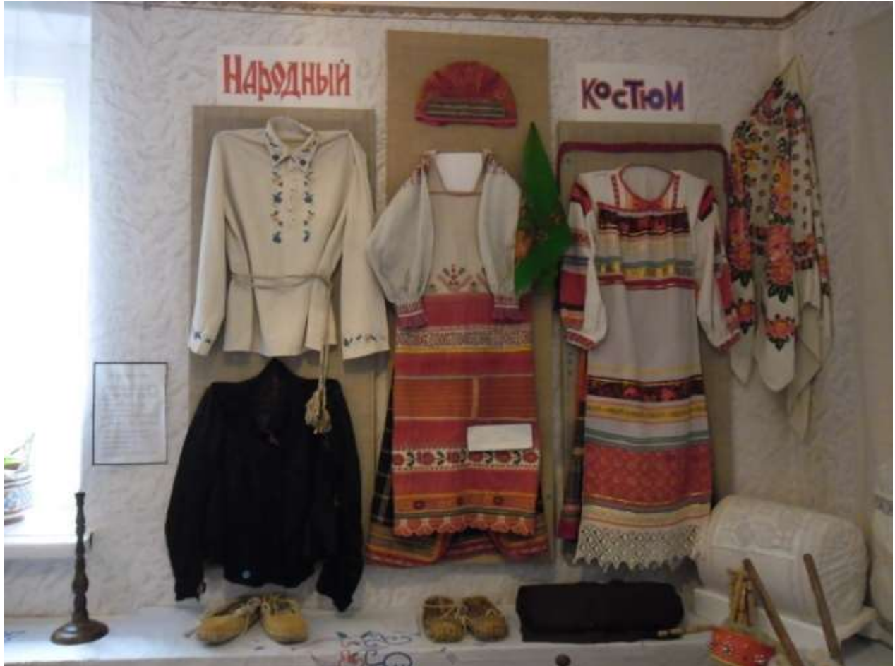
Фото 36. Экспозиция «Народный костюм».

Женский костюм представлен южно-русским паневным комплексом. Он представлен распашной паневою, фартуком-занавеской и элементами вышитой рубахи (рукавами), а также волосником (замужняя женщина прятала под него свои волосы). Распашная панева более характерна для выходцев из села Малевки. (Фото 36)