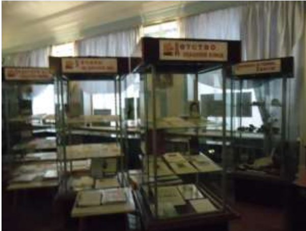
Фото 26. Экспозиции «Каменная летопись Земли», «Детство, опаленное войной», «У войны не женское лицо», «Педагоги в солдатских шинелях».

Широко известна шахтерская слава Богородицкого края. Это и Лауреат Ленинской премии Сироткин В. Е., и Герои Социалистического Труда, и Почетные шахтеры.