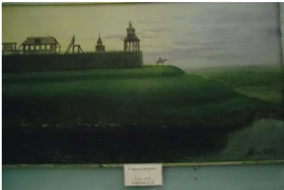
Фото 12. Город-ostroг. Картина. Гуаш, ДВП. Кошелев А.П.

В начале Богородицк состоял только из острога (крепости), обнесенного земляным валом. Внутри крепости находилась съезжая изба, склады хлеба, пороха, свинца, скотный и конюшенный дворы и другие постройки. По периметру крепость имела длину 600 метров, две проезжие и четыре наугольные башни. Из крепости к реке был сделан тайный ход.