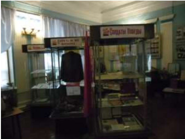
Фото 22. Экспозиции «Солдаты Победы», «Память на все времена», «История в письмах».

Следы той Великой войны остались до сих пор и на территории Богородицкого района и на территории Тульской области. Это железное эхо войны. И письма с фронта, как летопись боя, как хронику чувств перечтем. (Фото 20, 21, 22, 23)