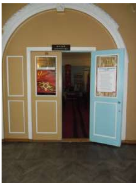
Фото 10. Вход в зал «Город и люди».

Обзорную экскурсию по залу «Город и люди» начнем с экспозиции, посвященной истории города Богородицка.