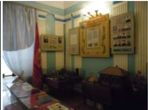
Фото 19. Экспозиции «Кавалеры ордена Славы», «Они учились в этом здании и ушли на фронт», «Герои Советского Союза – Наши земляки», «Города-герои», «Железное эхо войны.»

Богородчане сражались у стен 12 городов-героев и в Брестской крепости. Земля с братских могил и мест сражений передана в музей «Отечества». (Фото 19)