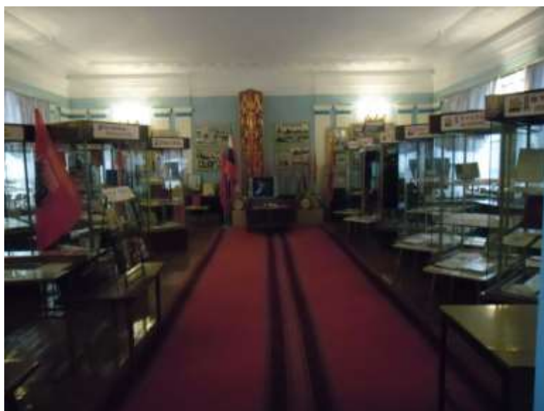
Фото 11. Общий вид зала «Город и люди».