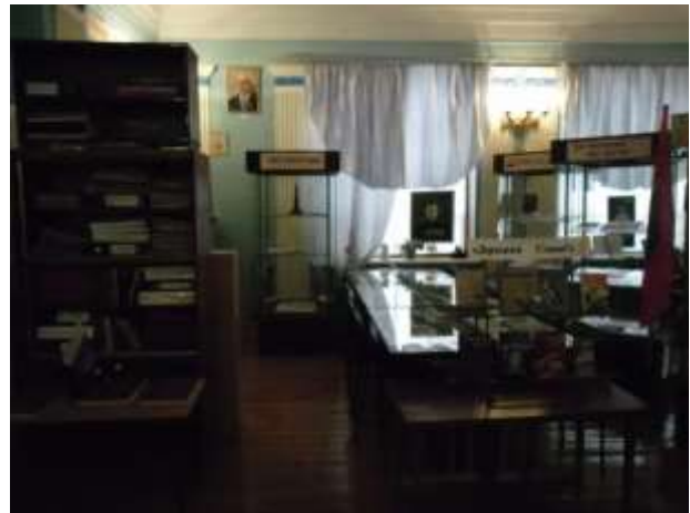
Фото 25. Экспозиции «Поле русской славы» и «Над пятью морями».

Среди богородчан, чье детство опалила война, юные защитники Родины и юные узники фашистских концлагерей. И пусть у войны не женское лицо, но в солдатских шинелях и «пудовых» кирзовых сапогах по комсомольскому призыву 1942 года ушли на фронт наши девушки. Стали в строй защитников Родины и люди такой мирной профессии, как учитель.