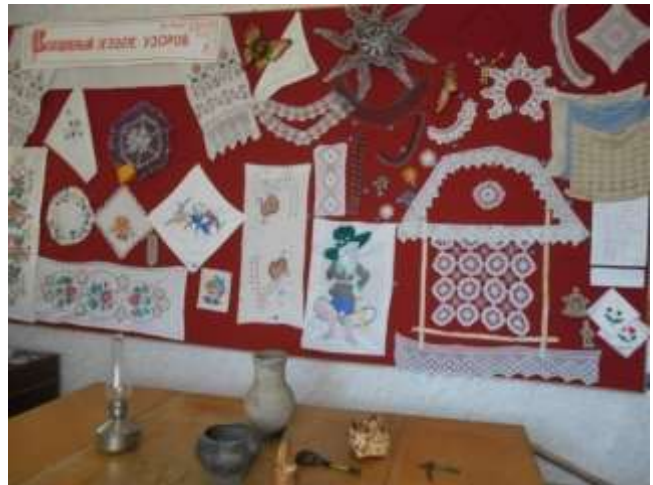
Фото 35. Экспозиция «Волшебный язык узоров».