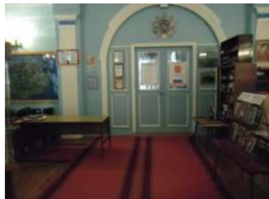
Фото 30. Размещение схемы города в этом зале музея.