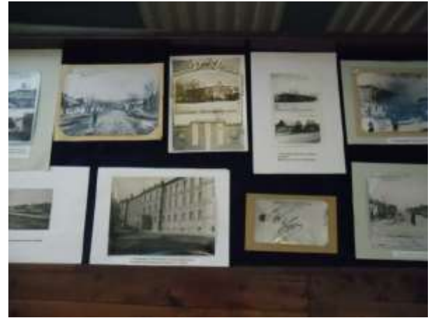
Фото 16, 17. Фрагменты экспозиции «Старинный Богородицк, ты мне дорог...»

В 1797 году при новом разделении государства на губернии, Богородицк опять попадает в число безуездных городов Тульской губернии. Но с 1802 года он опять становится уездным городом и остается им до Октябрьской революции 1917 года. Богородицк того времени – тихий захолустный уездный городок, хозяевами которого являлись крупнейшие земельные магнаты царской России – графы Бобринские. (Фото 16, 17)