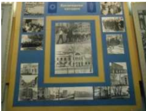
Фото 28. Богородицк в 60-ые годы XX столетия.

Именно с развитием угольной промышленности связано третье рождение Богородицка в 60-ые годы XX столетия. (Фото 28, 29, 30)