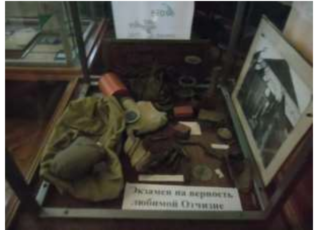
Фото 23. Фрагмент экспозиции «Память на все времена».

Поле русской славы - Куликовское поле питало своей живительной силой всех, кому довелось выполнять свой воинский долг в Великой Отечественной войне, в Афганистане и Чечне, тех, кто добровольцами ушли на ликвидацию последствий аварии на Чернобыльской АЭС, кто добывал в шахтах черное золото – уголь. (Фото 24, 25)