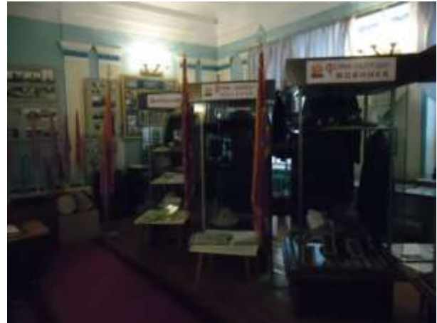
Фото 27. Экспозиции «Форма одежды военная» и «Шахтерская слава края».

Именно с развитием угольной промышленности связано третье рождение Богородицка в 60-ые годы XX столетия. (Фото 28, 29, 30)