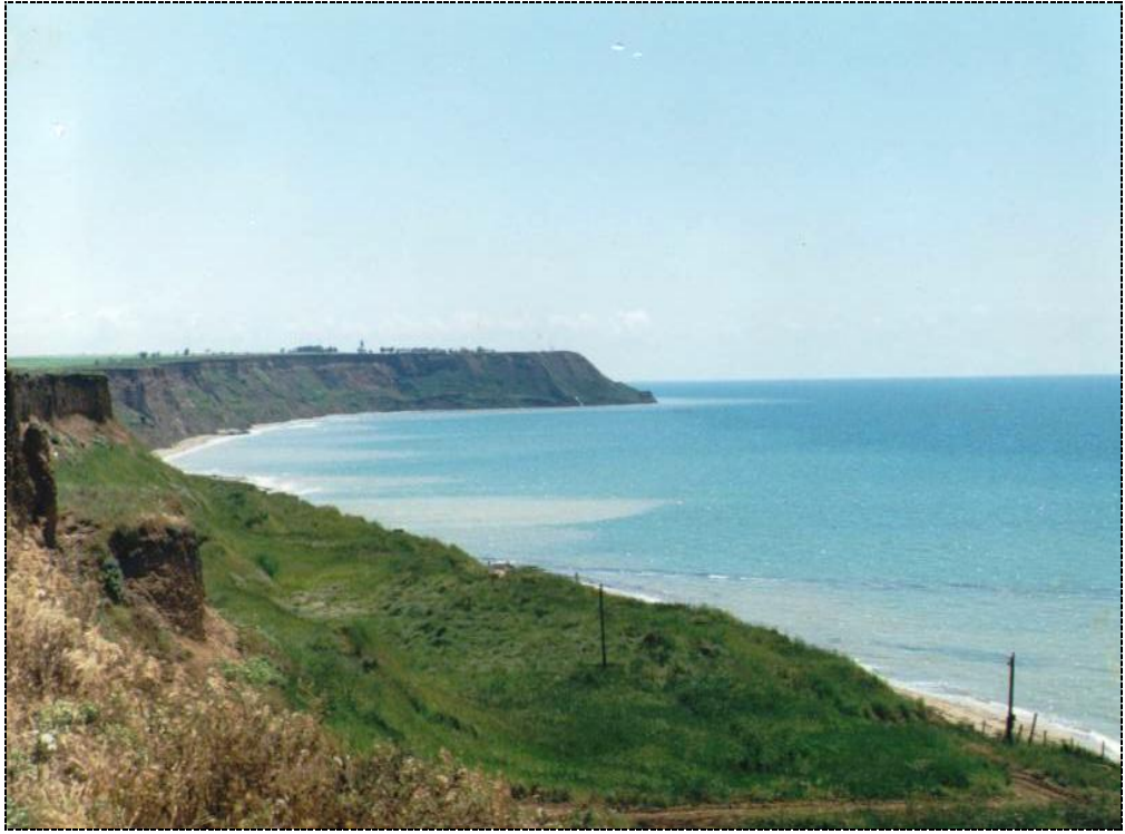
Мыс Железный рог станица Тамань