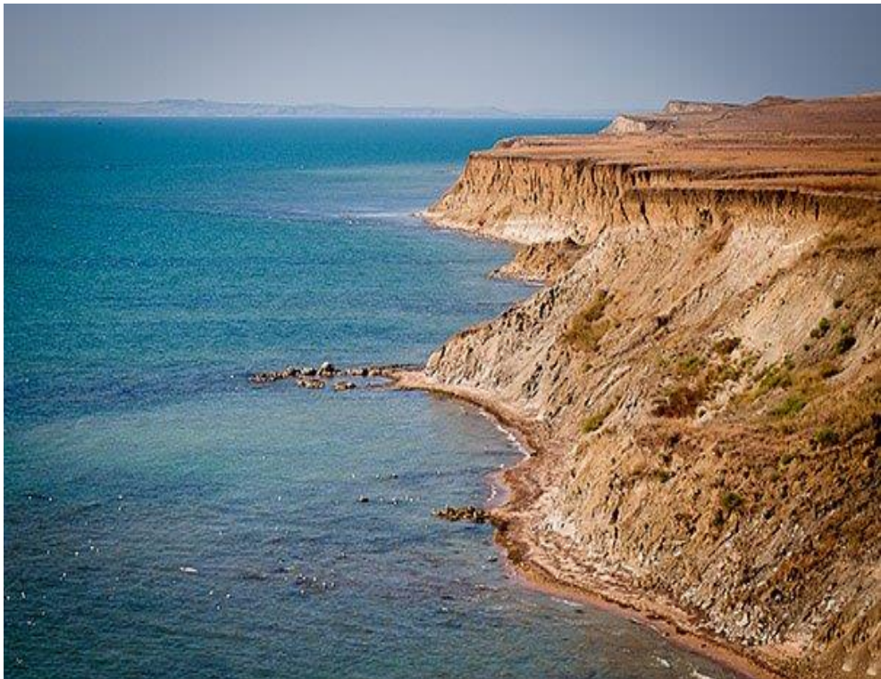
Мыс Панагия станица Тамань