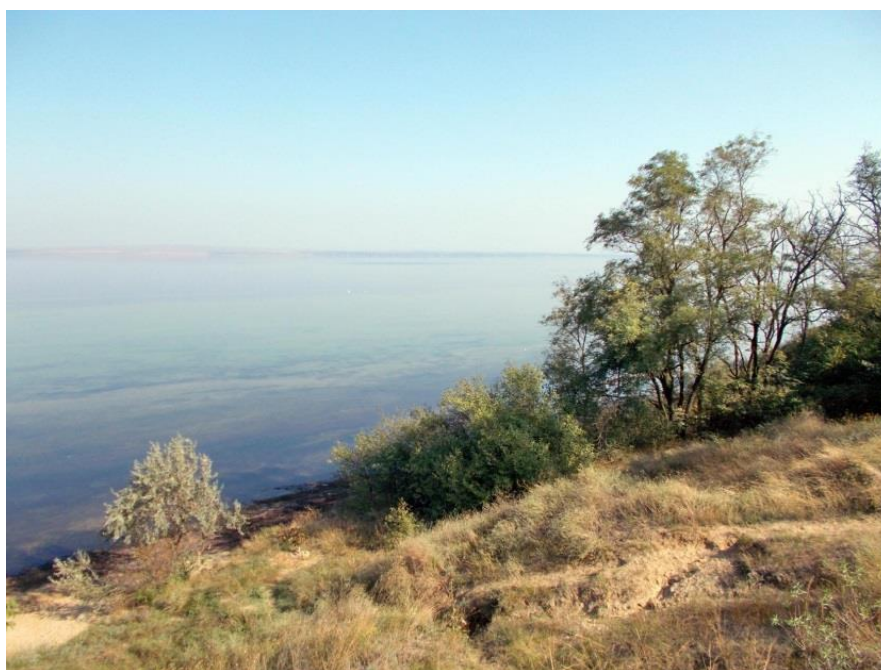
Ибрагимовский сад поселок Приморский