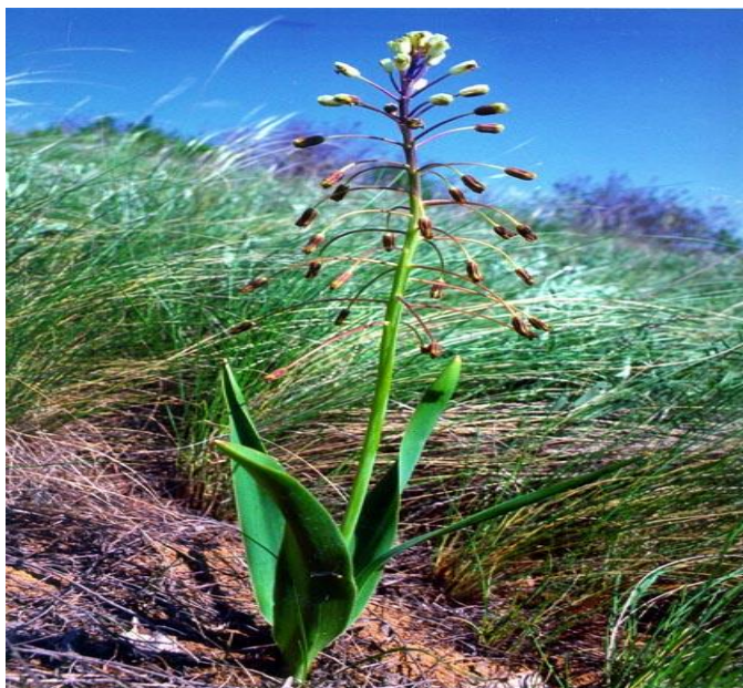
Бельвалия сарматская Bellevalia Sarmatica Woronov