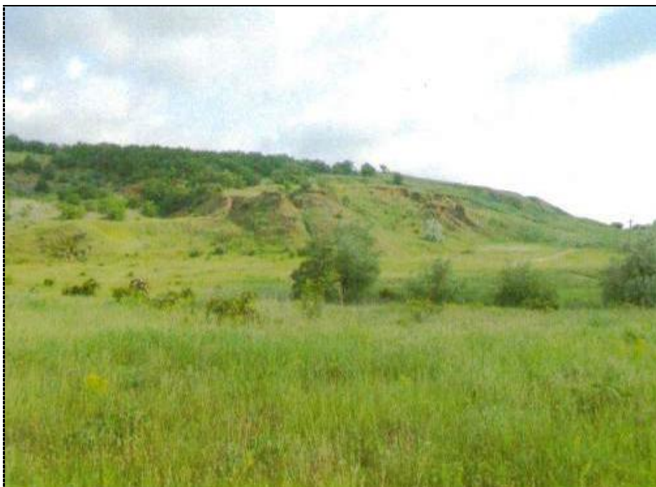
Урочище Дубовый рынок