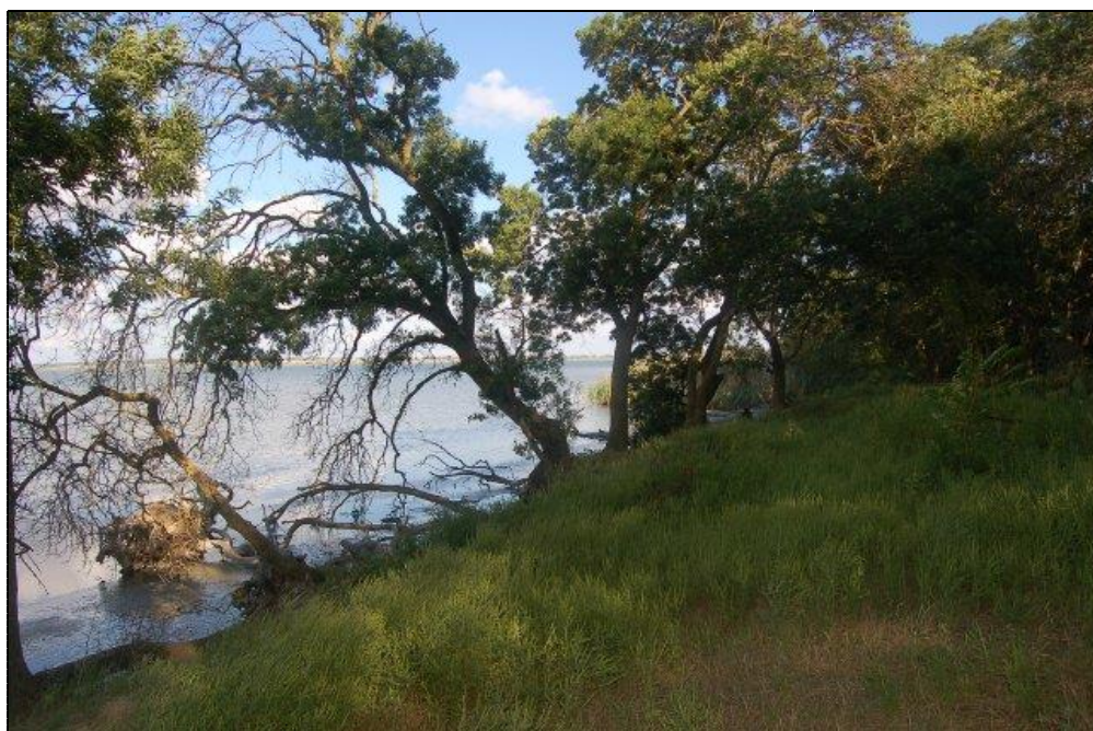
Сад Яхно станица Тамань