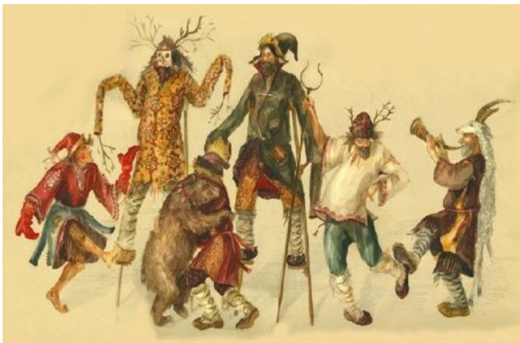
«Древняя Русь. Маски»