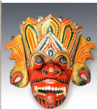
«Маски народов мира»