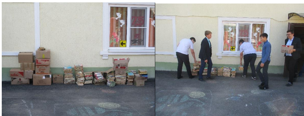
фото- и видеоматериалы о проведении Акции размещаются участниками в социальных сетях с указанием хештегов: #ДрузьяЗемли, #ДеньМакулатуры, #ЗемлеЖить.