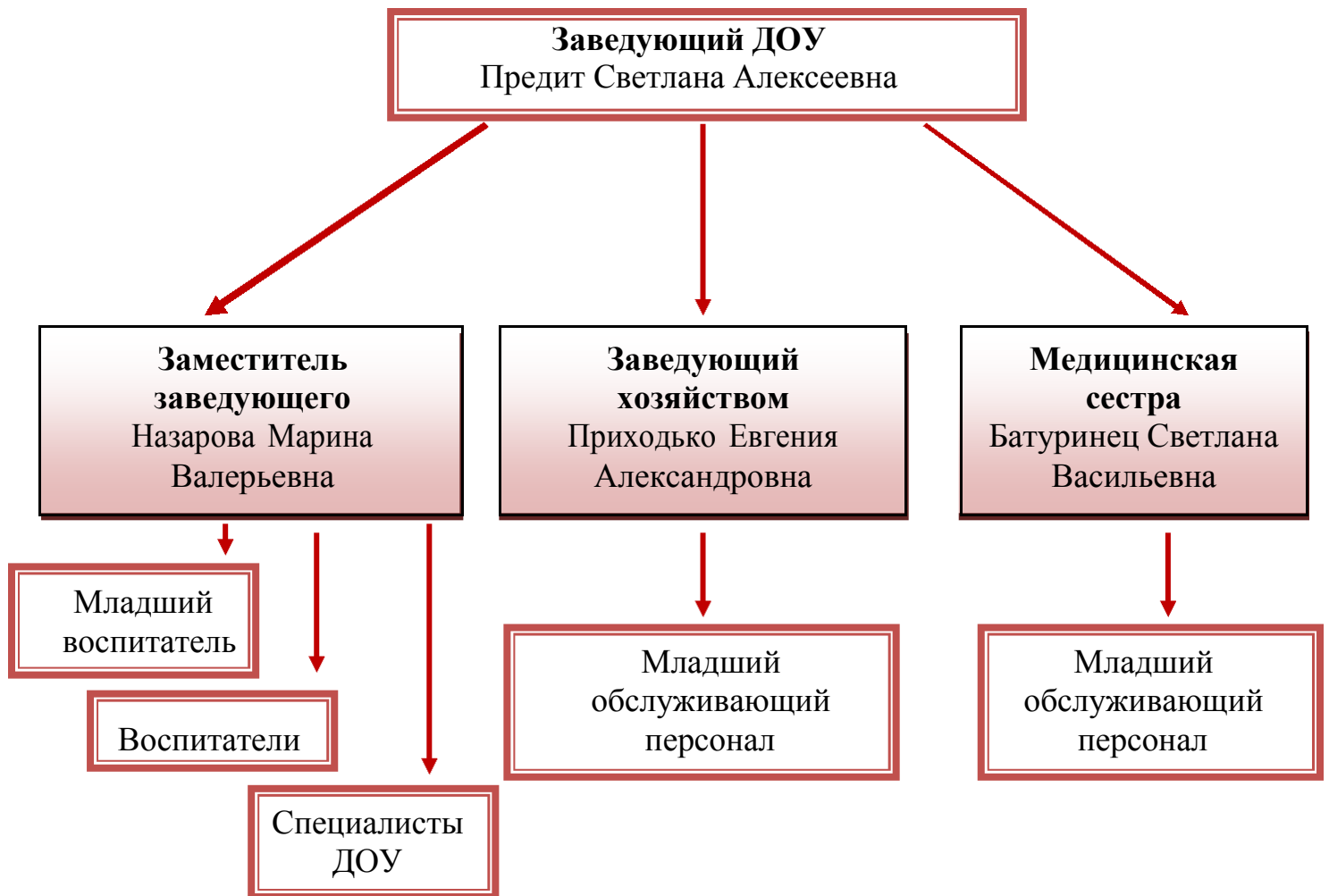
Схема 1 структуры «Административное управление ДОУ»