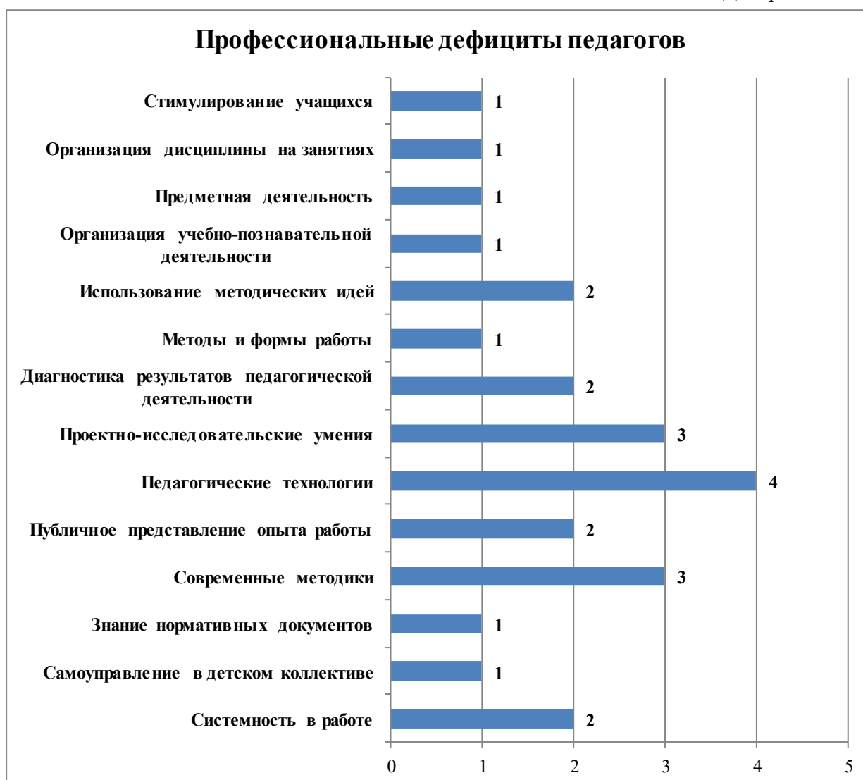
Диаграмма № 2

В целях выявления профессиональных дефицитов педагогов дополнительного образования, в 2024-2025 учебном году была проведена комплексная диагностическая методика «Профессиональные потребности и затруднения педагогов», которая разработана для самодиагностики педагога и благодаря трем вариантам ответов дает качественный и точный результат. Участие в опросе осуществлялось на добровольной основе и при соблюдении конфиденциальности. Опрошенные педагоги имели разный возраст и опыт работы. Информация, полученная в ходе комплексной диагностики, дает возможность построения индивидуального образовательного маршрута педагога. Следование данному маршруту и достижение поставленных целей значительно повысит качество образовательной услуги предоставляемой учреждением дополнительного образования.