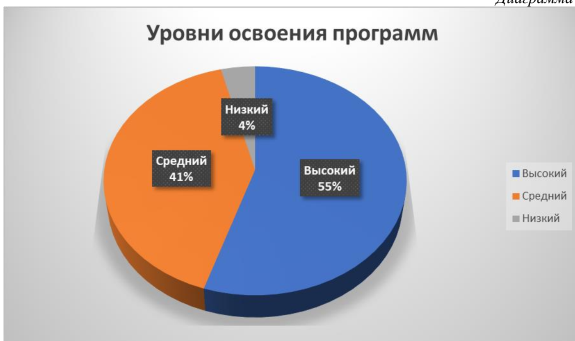
Диаграмма № 1

По результатам итоговой диагностики программы учебного плана реализованы успешно, всего 4 процента учащихся остались на начальном уровне подготовке, выявлено 18 одаренных детей – это победители и призеры краевых и Всероссийских соревнований и творческих конкурсов.