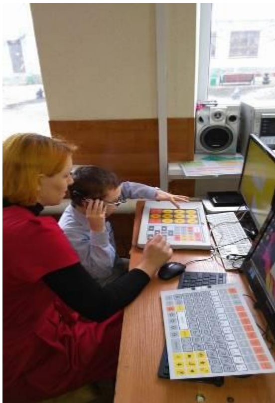
учебная зона (зона индивидуальной коррекционной работы)