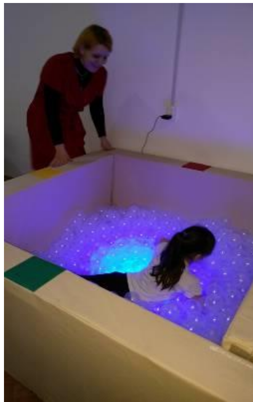
зона релаксации и снятия психо-эмоционального напряжения