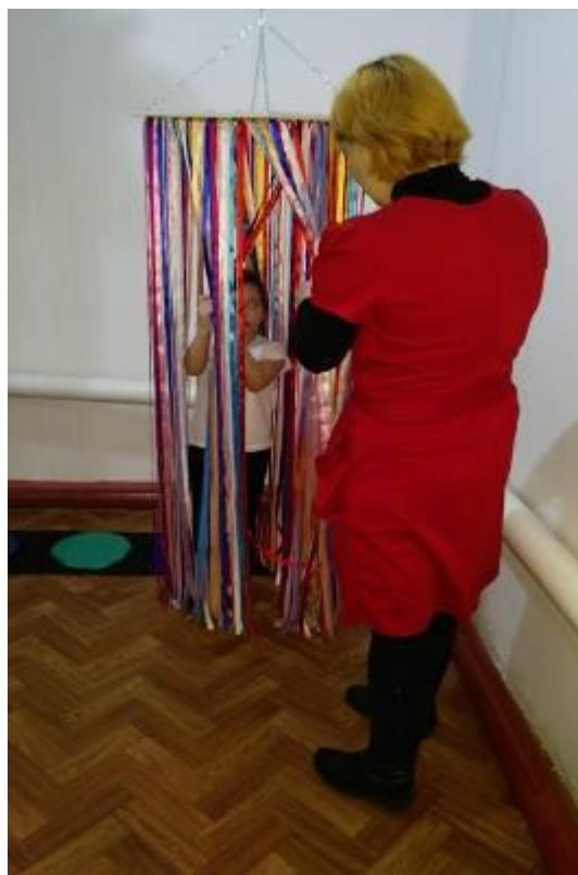
зона релаксации и снятия психо-эмоционального напряжения