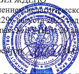
ТАБЛИЦА-СЕТКА ЧАСОВ УЧЕБНОГО ПЛАНА для 10-12 классов социально-экономического профиля ГКУ ССОШ № 2 города Краснодара Краснодарского края по ФГОС среднего общего образования на 2025-2026 учебный год (очно-заочная форма обучения)