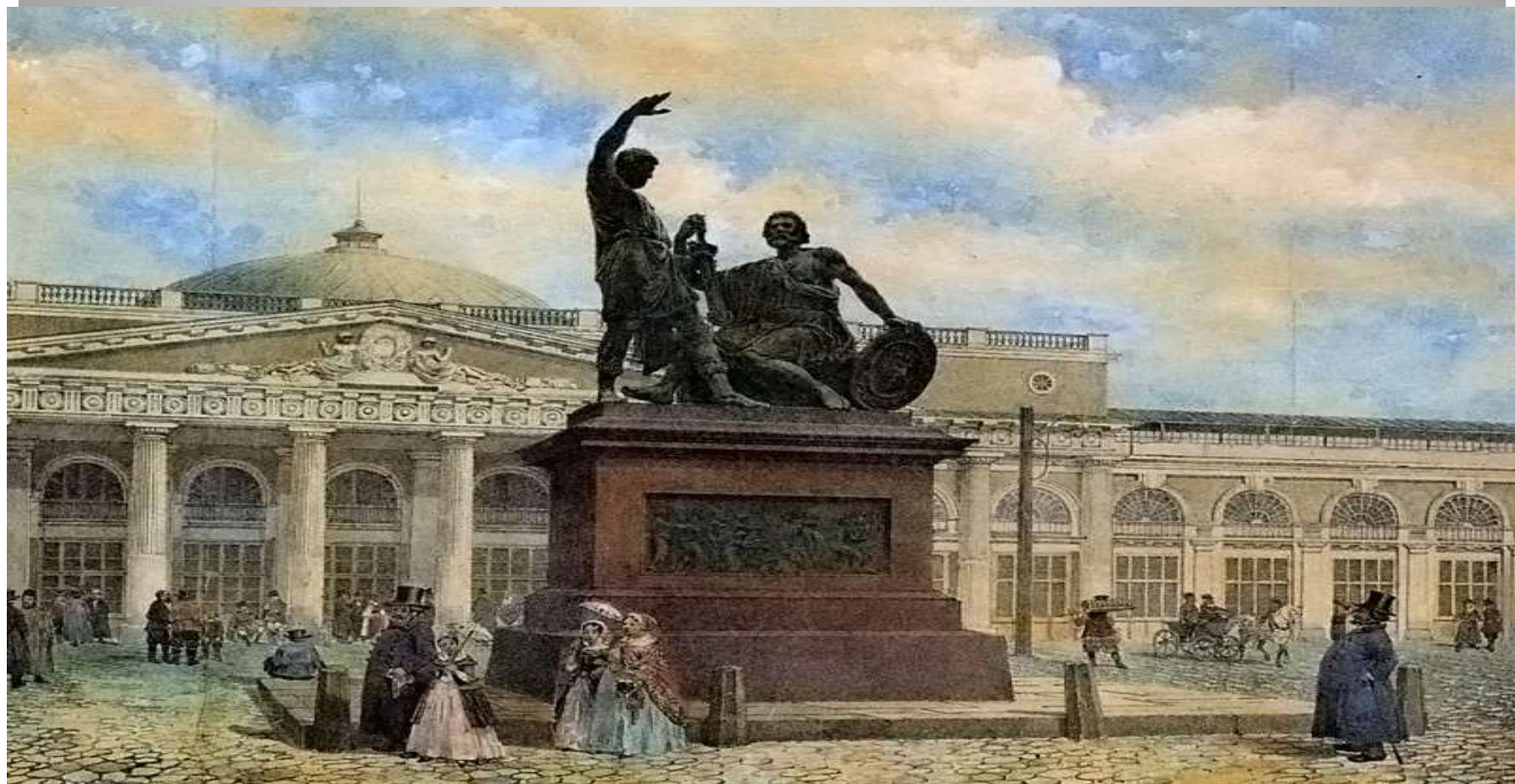
Памятник Кузьме Минину и Дмитрию Пожарскому в Москве.