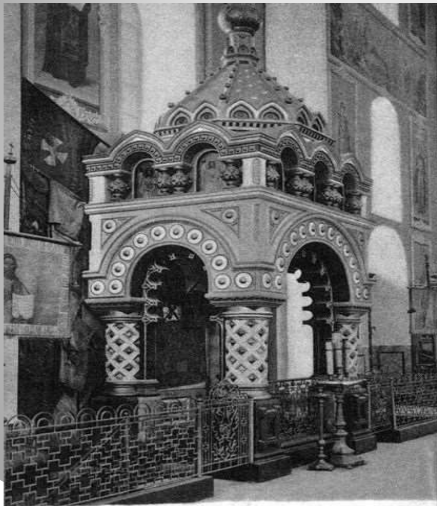
Гробница К.Минина в Михайлово-Архангельском соборе(г.Нижний Новгород)