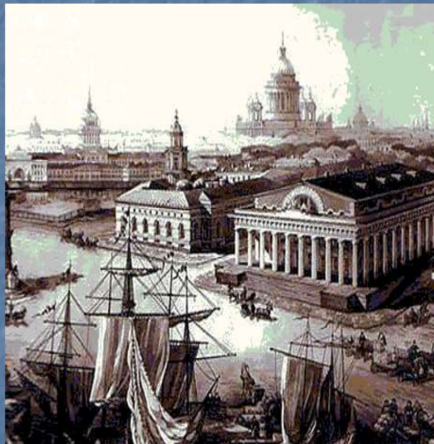
Стрелка Васильевского острова