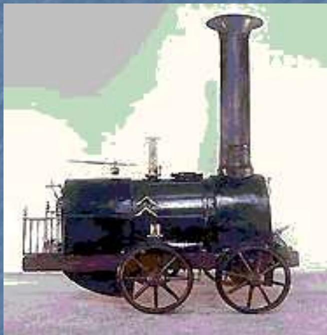
Модель первого российского паровоза (Черепановы)