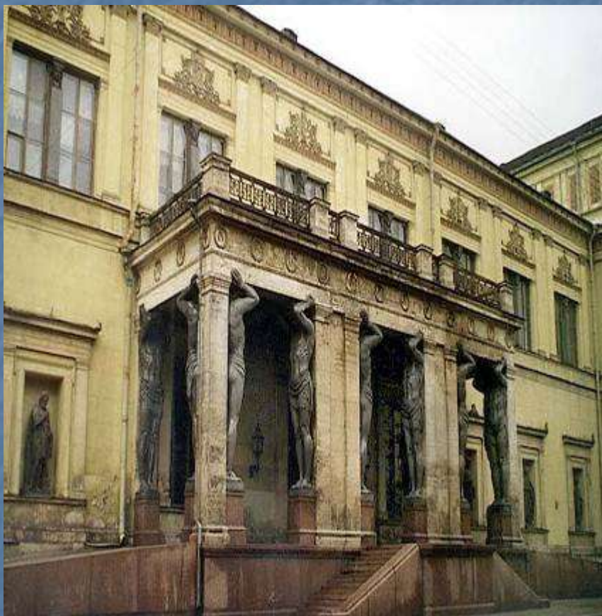
Портик Нового Эрмитажа