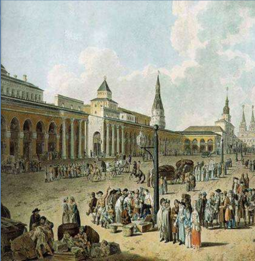
Вид на Красную площадь