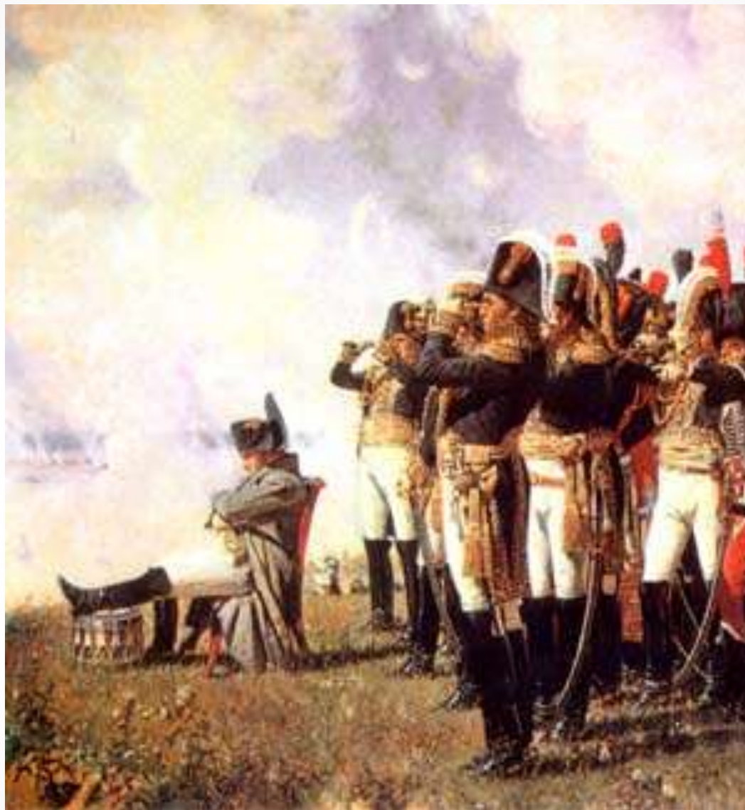
• Наполеон и его армия •