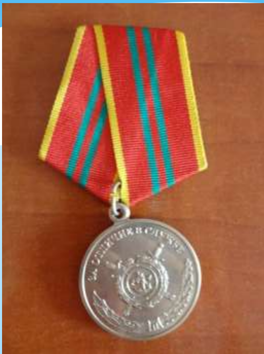
За 10 лет службы в милиции.