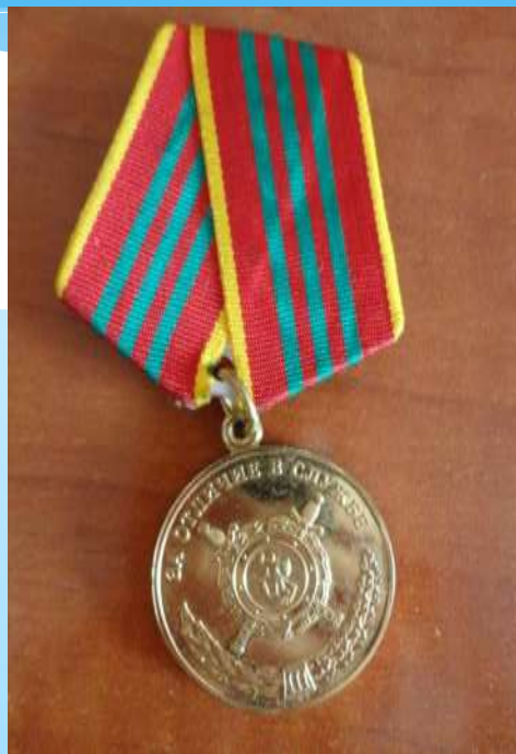
За 15 лет службы в полиции.