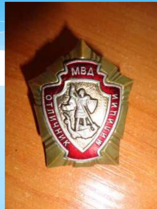
За отличную работу.