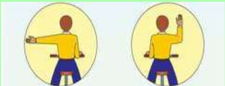
Сигнал левого поворота или разворота