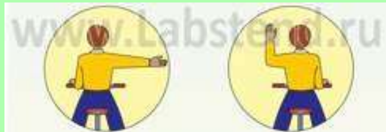
Сигнал правого поворота

Подача сигнала должна производиться заблаговременно (до начала выполнения маневра) и может быть прекращена непосредственно перед выполнением маневра.