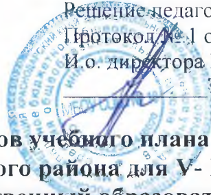
Таблица – сетка часов учебного плана МБОУ СОШ № 18 Отрадненского района для V- IX классов, реализующих федеральный государственный образовательный стандарт основного общего образования, на 2020 - 2021 учебный год