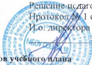
Таблица – сетка часов учебного плана МБОУ СОШ № 18 Отрадненского района для 1-IV классов, реализующих федеральный государственный образовательный стандарт начального общего образования на 2019 – 2020 учебный год