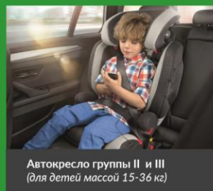
Автокресло группы II и III (для детей массой 15-36 кг)