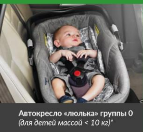
Автокресло «люлька» группы 0 (для детей массой < 10 кг)*

При покупке детского удерживающего устройства обязательно следует уточнить у продавца наличие сертификата на товар!