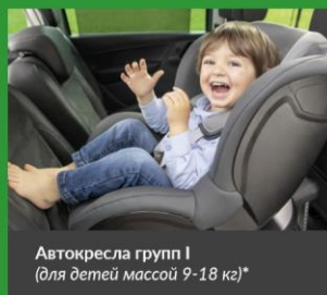
Автокресла групп I (для детей массой 9-18 кг)*