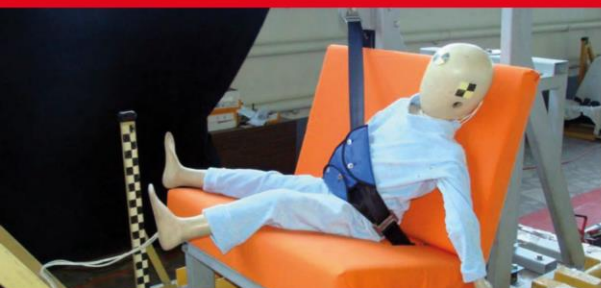
Результаты тестов использования небезопасных удерживающих устройств*

Дополнение определения «направляющая ляжка» в Правилах ЕЭК ООН № 44-04 было одобрено Всемирным Форумом (WP.29). Внесенная поправка к формулировке указывает на то, что « направляющая ляжка рассматривается как составной элемент детской удерживающей системы и НЕ может отдельно официально утверждаться в качестве детской удерживающей системы в соответствии с настоящими Правилами». Это исключает даже формальную возможность сертификации устройств типа «направляющая ляжка»!