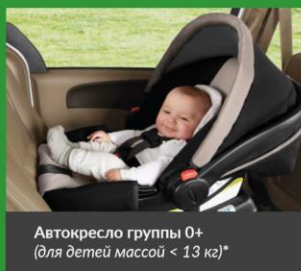
Автокресло группы 0+ (для детей массой < 13 кг)*