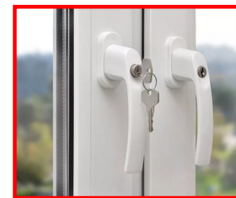
ручка с детским замком