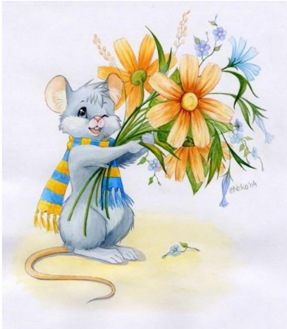
Рисунок 4. Открытка №3 (к методике «Секрет»)