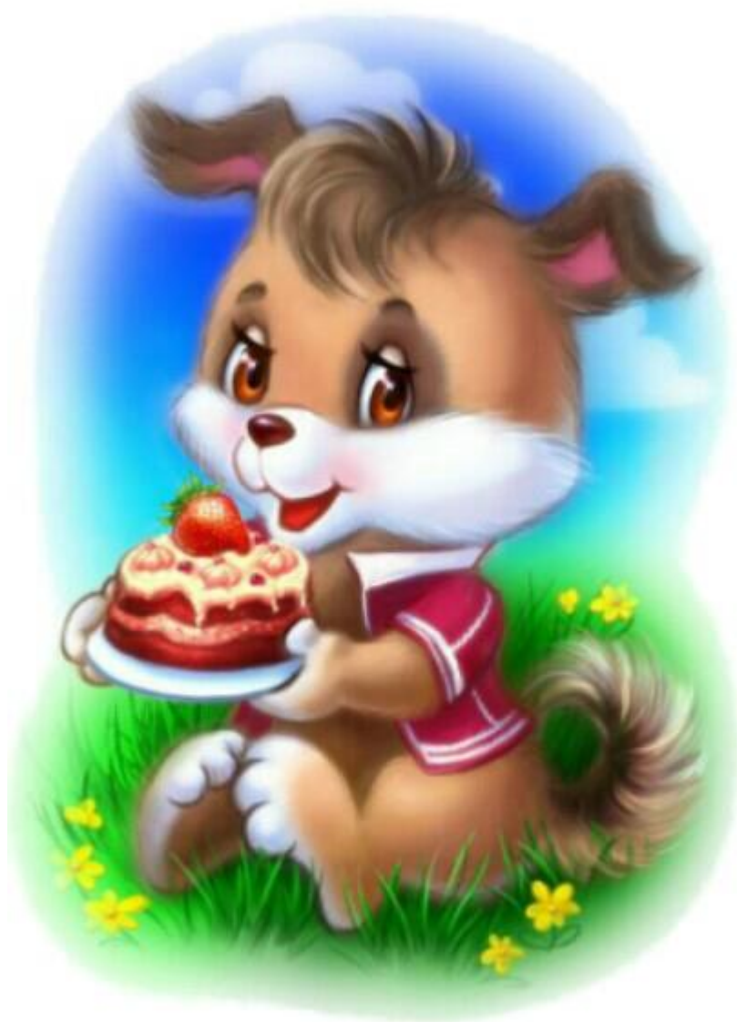
Рисунок 3. Открытка №2 (к методике «Секрет»)