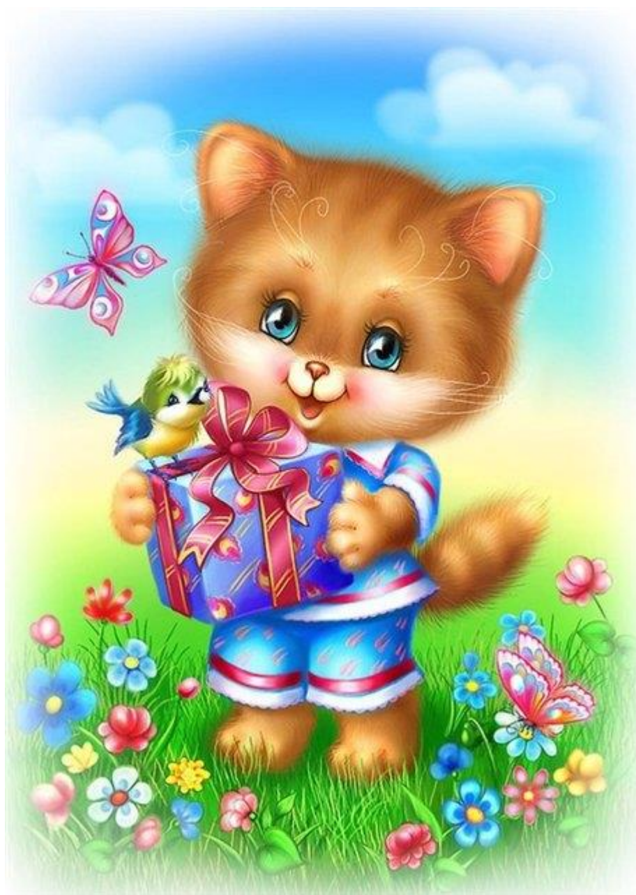
Рисунок 2. Открытка №1 (к методике «Секрет»)