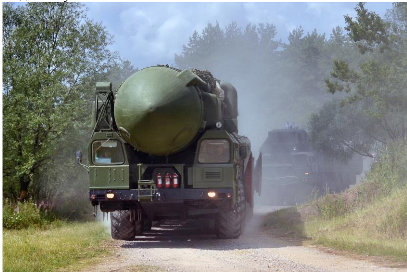
На марше – ПГРК «Тополь»

инженерный и химический городки, тактическое поле, учебные командные пункты.