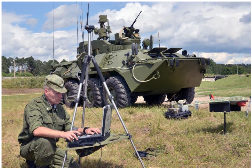
Освоение беспилотных летательных аппаратов

Особое внимание в филиале академии уделяется эстетическому воспитанию курсантов, организации их культурного досуга.