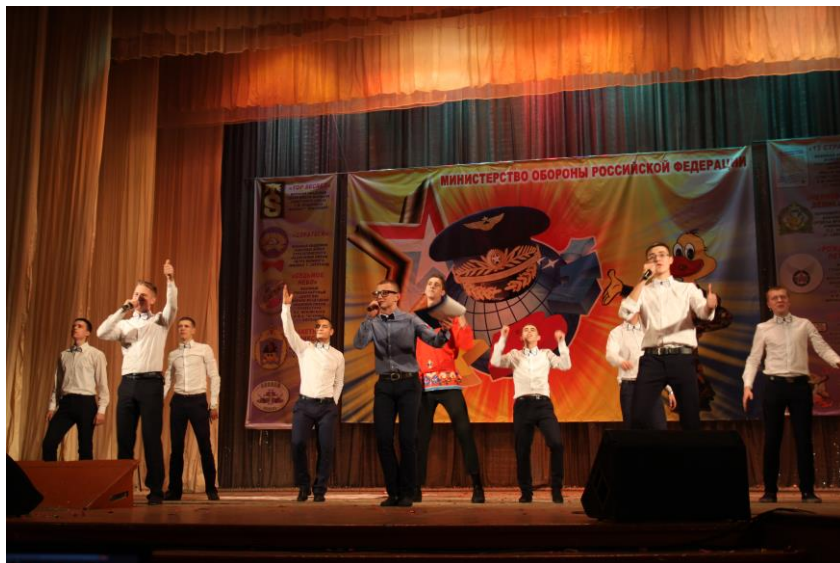
Выступление команды КВН филиала академии.