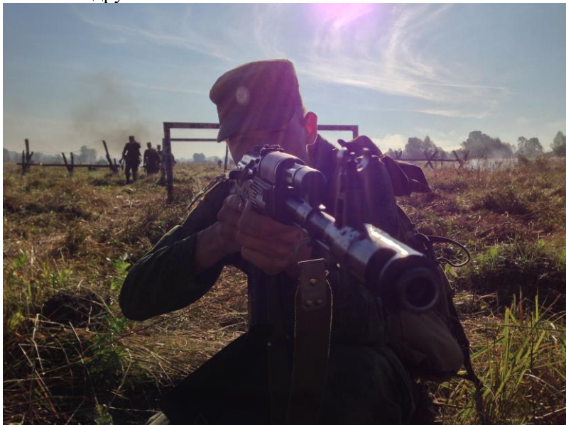
На занятии по общей тактике

начертательной геометрии, черчению, теории автоматического управления и другим.