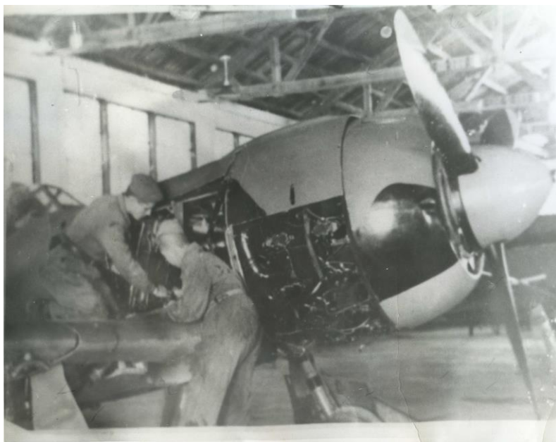
Изучение боевых самолетов. 1943 год

В 1968 году училище было удостоено звания имени Ленинского комсомола.