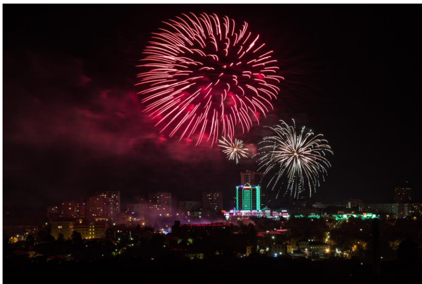
Салют в честь Дня города (вид на центр города)

Древний кремль на Соборной горе воздвигнут в 1374 году, тогда же были построены монастыри-крепости: в 1360 году на правом берегу реки Нары - Владычный, а в 1374 году на левом - Высоцкий.