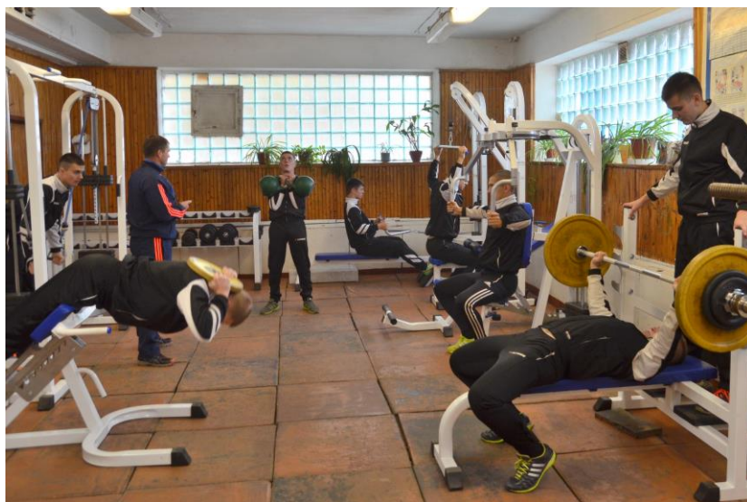
Занятие в тренажерном зале