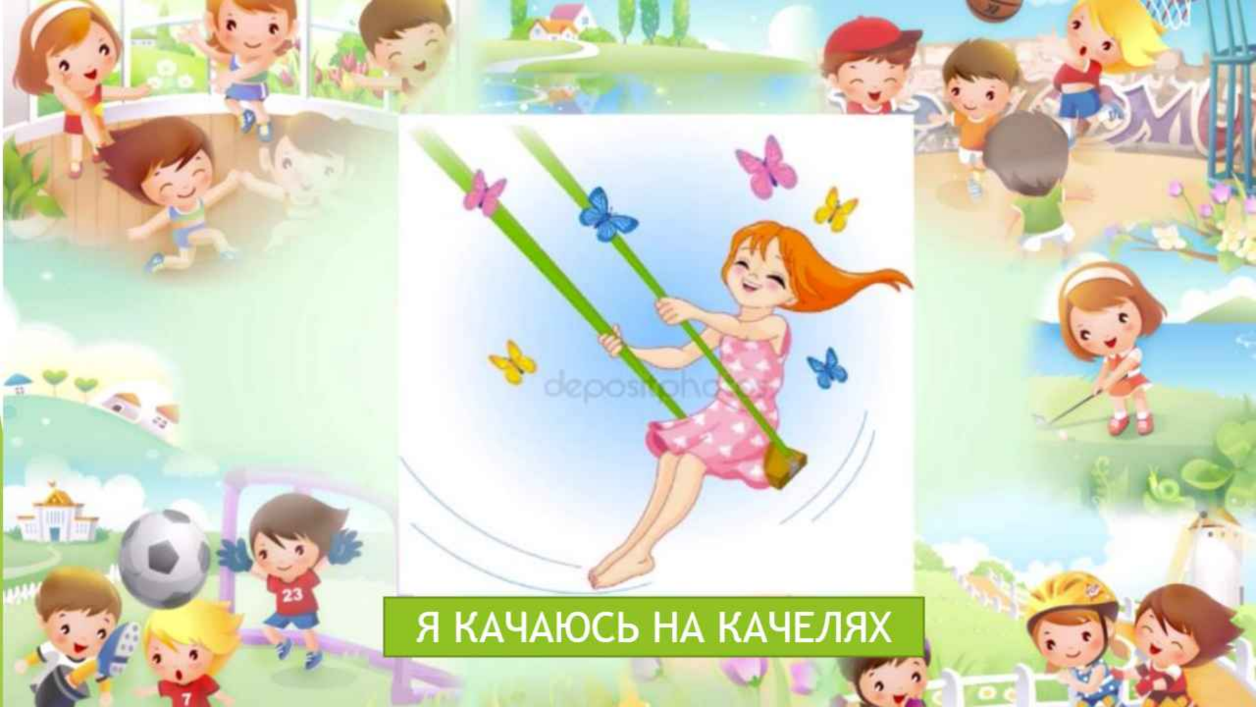
Я качаюсь на качелях