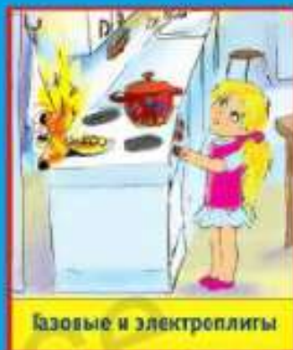
Газовые и электроплиты