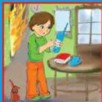
Вызвать пожарных по телефону 01