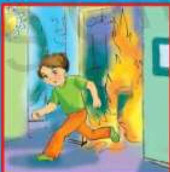
Если потушить невозможно, срочно покинуть помещение