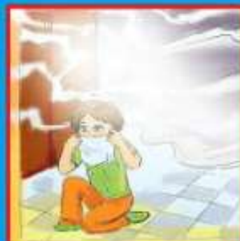
В задымленном помещении дышать через мокрую ткань