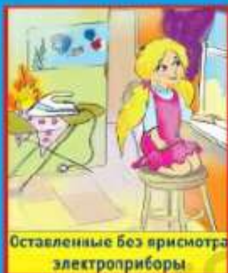
Оставленные без присмотра электроприборы