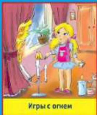
Игры с огнем