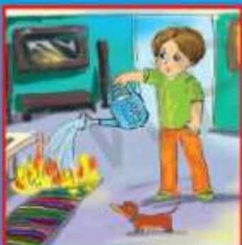
Мелкое возгорание потушить подручными средствами