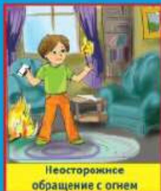
Неосторожное обращение с огнем