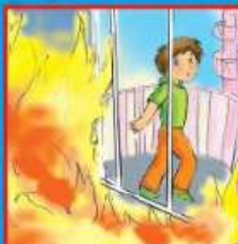
Если выйти невозможно, найти источник свежего воздуха, выбраться на балкон