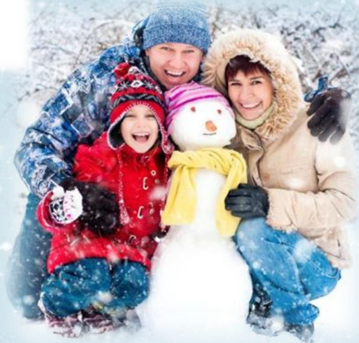
Фото-сессия на природе

Возьмите с собой на прогулку фотоаппарат и устройте зимнюю семейную фото-сессию. В перерыве между съемкой можно организовать пикник: подготовьте чай в термосе, возьмите с собой бутерброды, сладости. У детей останутся незабываемые впечатления!