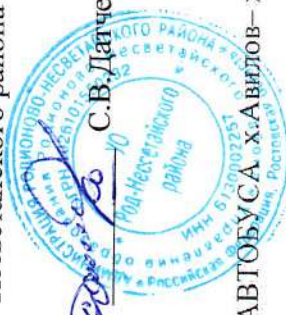
СХЕМА МАРШРУТА ДВИЖЕНИЯ № 27 ШКОЛЬНОГО АВТБУСА х.Авилов – х.Большой Должик – х.Авилов