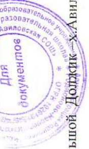
СХЕМА МАРШРУТА ДВИЖЕНИЯ № 27 ШКОЛЬНОГО АВТБУСА х.Авилов – х.Большой Должик – х.Авилов