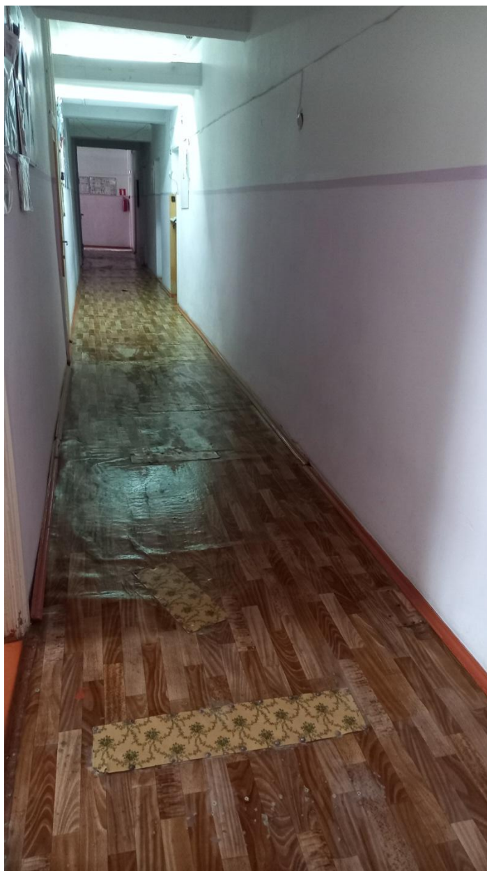
Коридор 1 этаж.