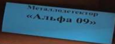
Металлодетектор «Альфа 09»