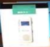
Диктофон Benjie S6