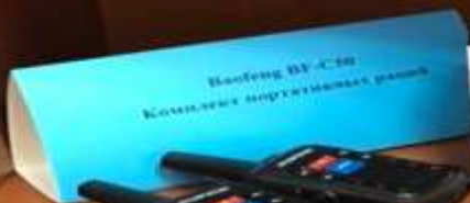
Beifeng BU-C50 Комплекс портативных радио