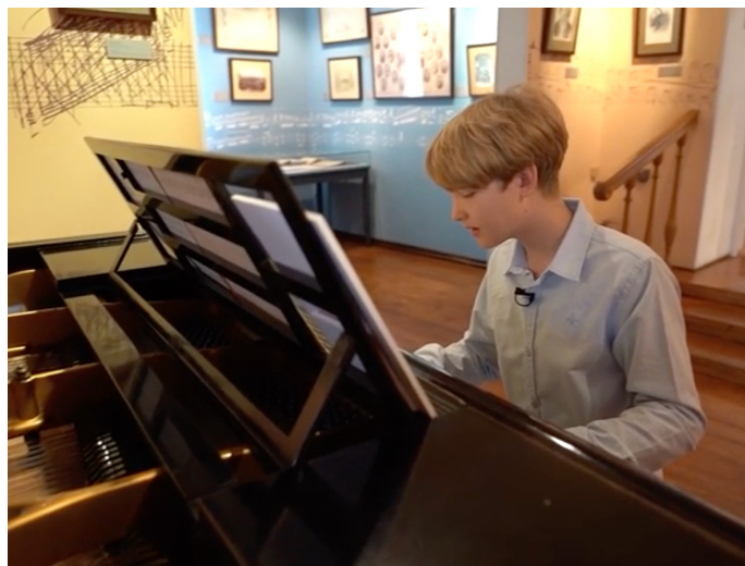
«Великие русские композиторы»