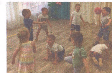
Материал подготовила воспитатель Иванова А.И.