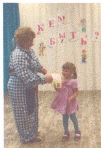
Материал подготовила воспитатель Иванова А.И.