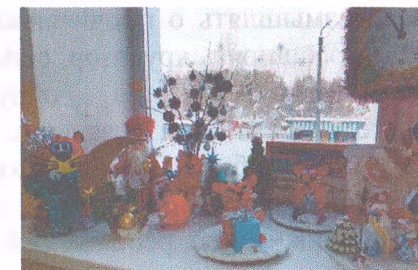
Материал подготовила воспитатель Щекина Т.С.