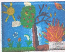
Материал подготовила воспитатель Гурьева Ю.В.