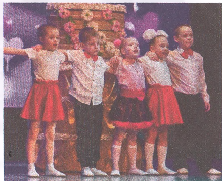
Материал подготовила воспитатель Захарова С.А.