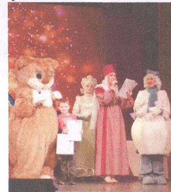
Материал подготовила воспитатель Иванова А.И.