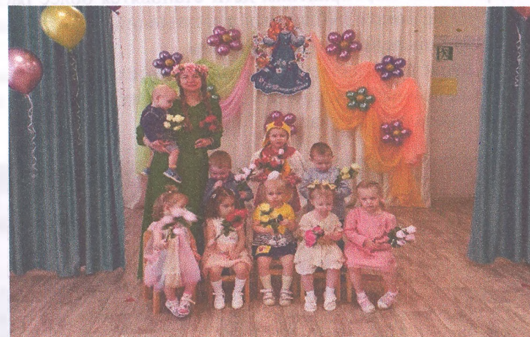
Материал подготовила воспитатель Этлер С.А

К встрече с весной дети вместе с педагогами готовились заранее: разучивали песенки, танцы, игры. Встреча с Весной прошла в нарядном музыкальном зале наполненном музыкой добротой, что помогло детям получить заряд бодрости и хорошего настроения.