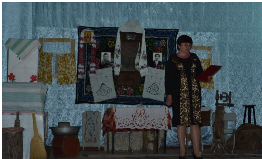
Литературно – театрализованная композиция «Село Латоново. Годы оккупации»