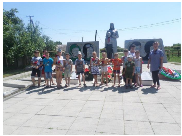
Акция «Кораблики мира» и возложение цветов к мемориалу Победы.