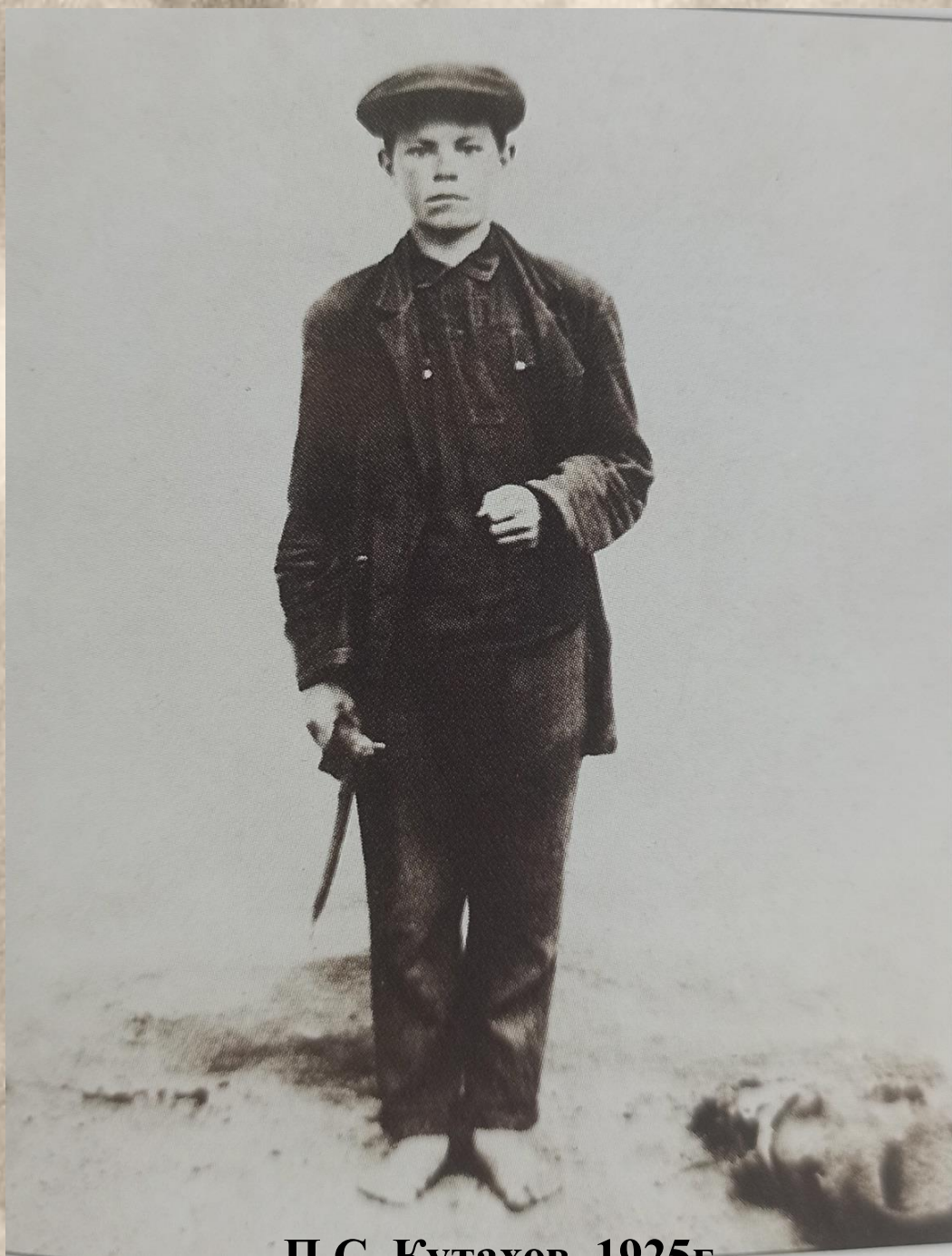
П.С. Кутахов. 1925г.