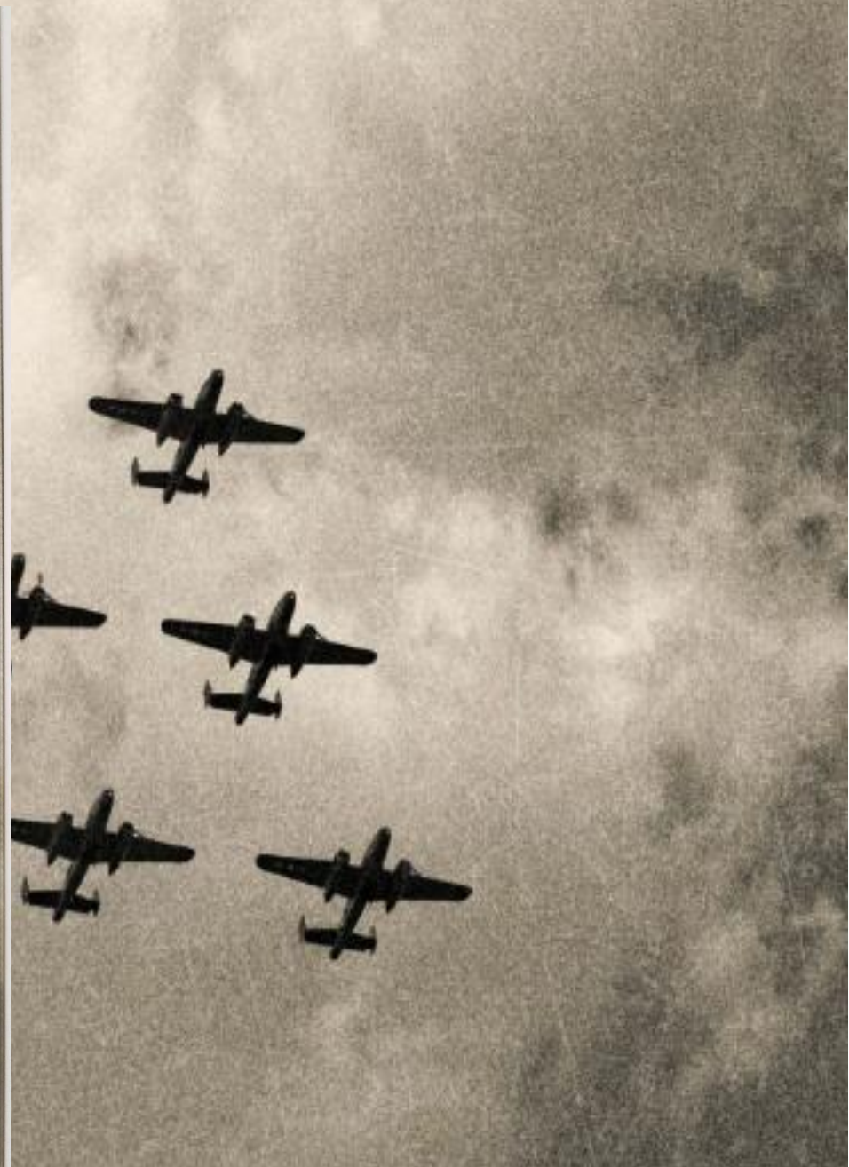
П.С. Кутахов. 1934г