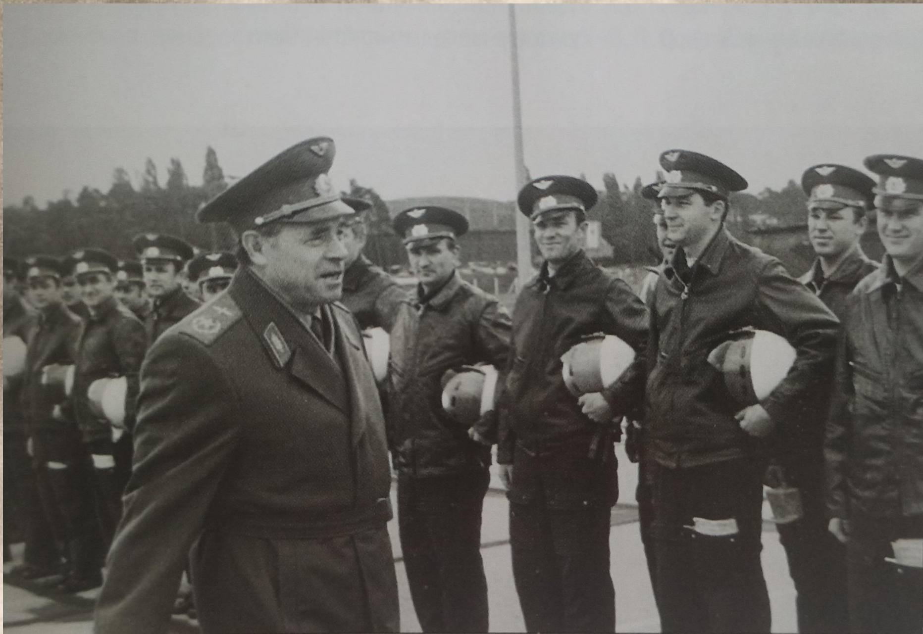
Встречи Кутахова с лётным составом