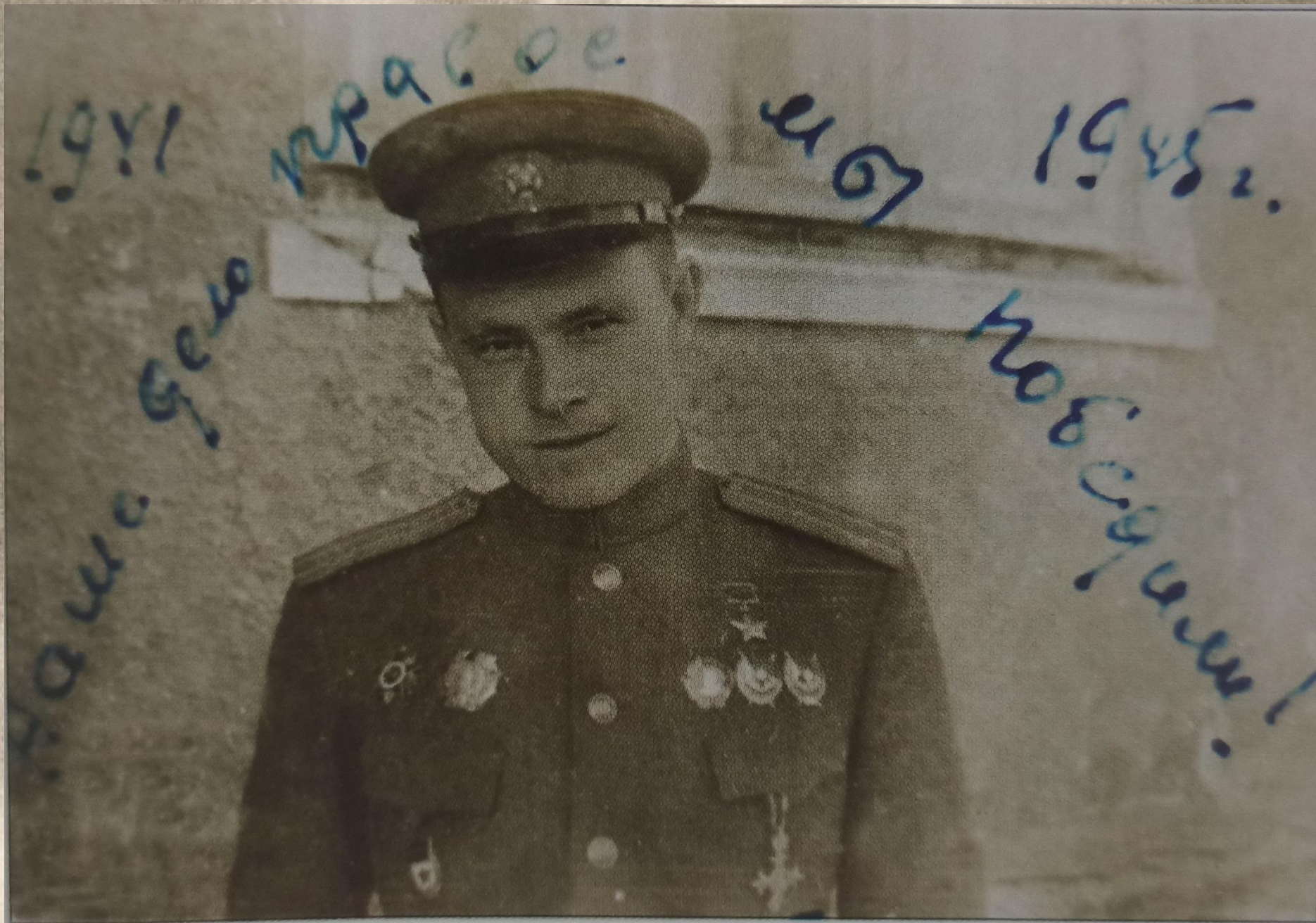
Гвардии подполковник П.С. Кутахов в День Победы.