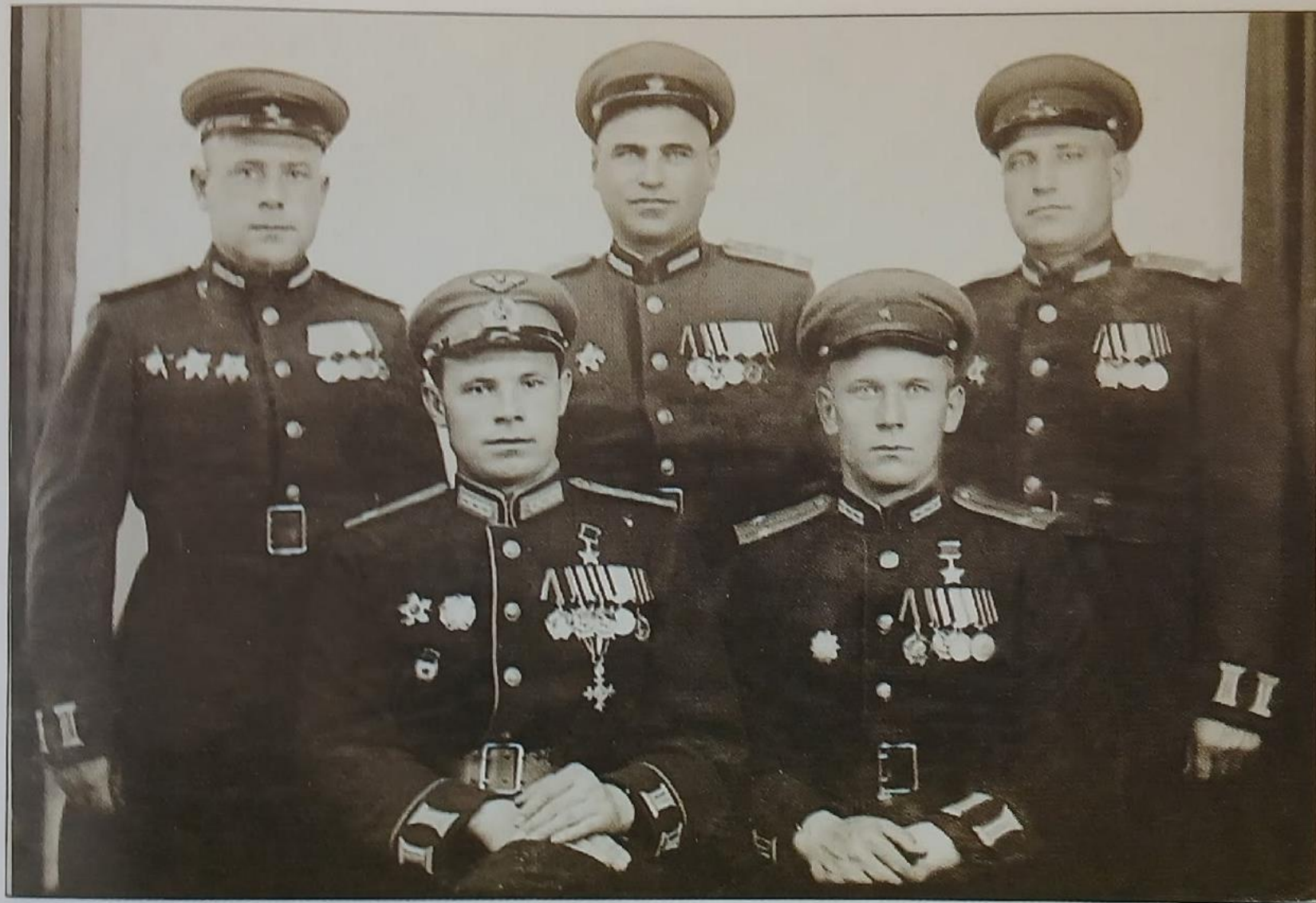
▲ П.С. Кутахов с участниками Парада Победы от Карельского фронта. Июнь 1945 года