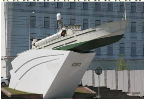
Памятник морякам-черноморцам (г. Новороссийск)

Не забыты Новороссийском и герои-матросы. В 1968 г, в честь 25-летия битвы за город, был торжественно открыт ПАМЯТНИК ГЕРОИЧЕСКИМ МОРЯКАМ-ЧЕРНОМОРЦАМ .