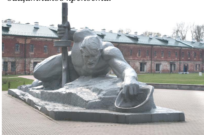
Один из памятников мемориального комплекса «ЖАЖДА»

Однако фашисты встретили со стороны защитников Брестской крепости яростный и ожесточенный отпор.