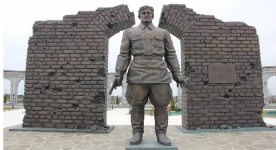
★ «Последний защитник Брестской крепости»

★ «Я умираю, но не сдаюсь! Прощай Родина. ★ 20/VII-41», в подвале Белого дворца в 1958 ★ г. – «Умираем не срамя». По показаниям ★ свидетелей, последние очаги ★ сопротивления были подавлены только в ★ конце августа, т.е. спустя два месяца с ★ момента штурма.