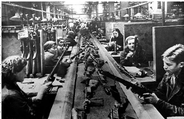
сборка оружия на автомобилестроительном заводе им. Лихачева

Как только началась Великая Отечественная Война столица СССР - город Москва, являлась одним из основных направлений всех ударов. Наступление на Москву началось в сентябре 1941г. С начала войны многие промышленные предприятия Москвы были эвакуированы, началась эвакуация правительственных учреждений в Куйбышев. Однако работа многих предприятий продолжалась, их производство было перепрофилировано на выпуск военной продукции.