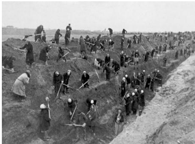
строительство Московской зоны обороны силами народного ополчения

На защиту родного города вышло все трудоспособное гражданское население: трудящиеся столицы, москвичи-добровольцы - прилагали все усилия для того, чтобы остановить атаку противника.