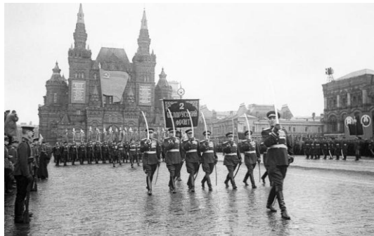
24 июня 1945г. Москва принимала триумфальный Парад Победы.

Безусые, почти что дети, Мы знали в яростный тот год, Что вместо нас никто на свете За этот город не умрет. (И. Иванов)