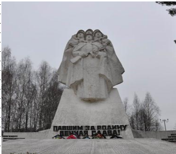
Памятник погибшим в Битве за Москву

4 мая 1944 года Президиум Верховного совета СССР учредил медаль "За оборону Москвы", которой были награждены сразу более миллиона ее защитников.