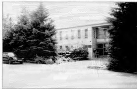
Здание правления ООО «Екатериновское».

Важнейшую роль в Екатериновке играет школа. За 106 лет своего существования она стала настоящей кузницей кадров.