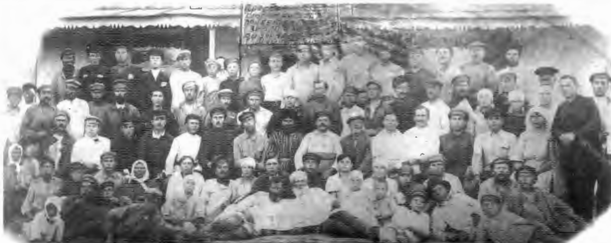
Первая конференция в селе Екатериновке Таганрогского округа батраков и бедняков. 1923 год.