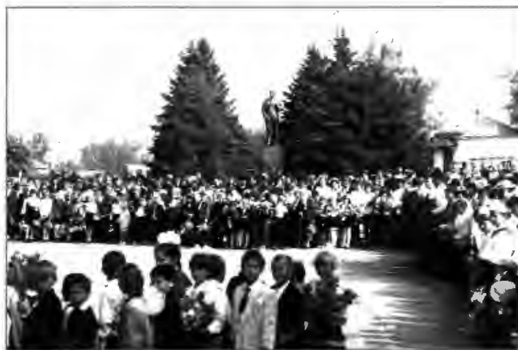
Празднование Дня Победы в Екатериновке.