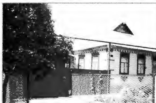
Екатериновка вчера и сегодня.

За последнее время администрация поселения серьезно занимается благоустройством населенных пунктов, обновлением и развитием инфраструктуры: восстановлены два детских садика; газифицированы школы и детские сады, Дом культуры, АТС, врачебная амбулатория, почтовое отделение в Екатериновке; произведен капитальный ремонт дорог в Екатериновке и построена новая дорога к школе в Григорьевке, установлено 213 светильников уличного освещения. При очень серьезном финансовом дефиците администрации удастся привлечь спонсорские средства для решения этих вопросов. Только в 2006 году предпринимателями и фермерами выделено более 150 тысяч рублей. Благодаря этому удалось отремонтировать два моста через речку Сухой Еланчик и отсыпать 8 километров дороги, провести праздники и чествовать ветеранов войны и труда.