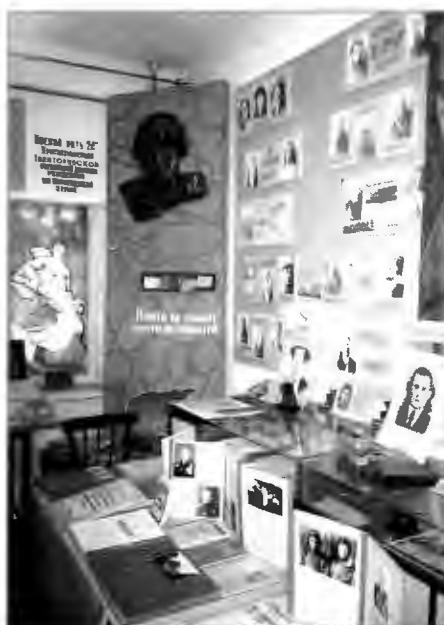
Экспозиции школьного музея.