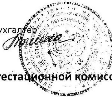
График работы аттестационной комиссии организации