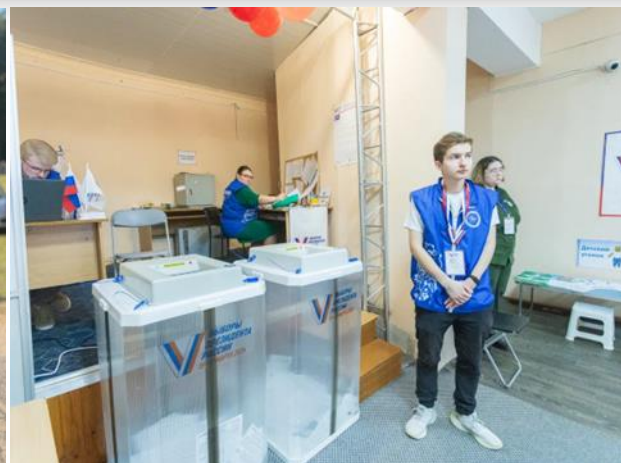
Молодежные участковые избирательные комиссии