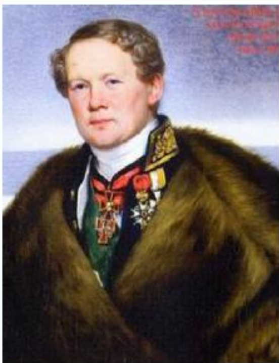
Огюст Монферран 1786 - 1858