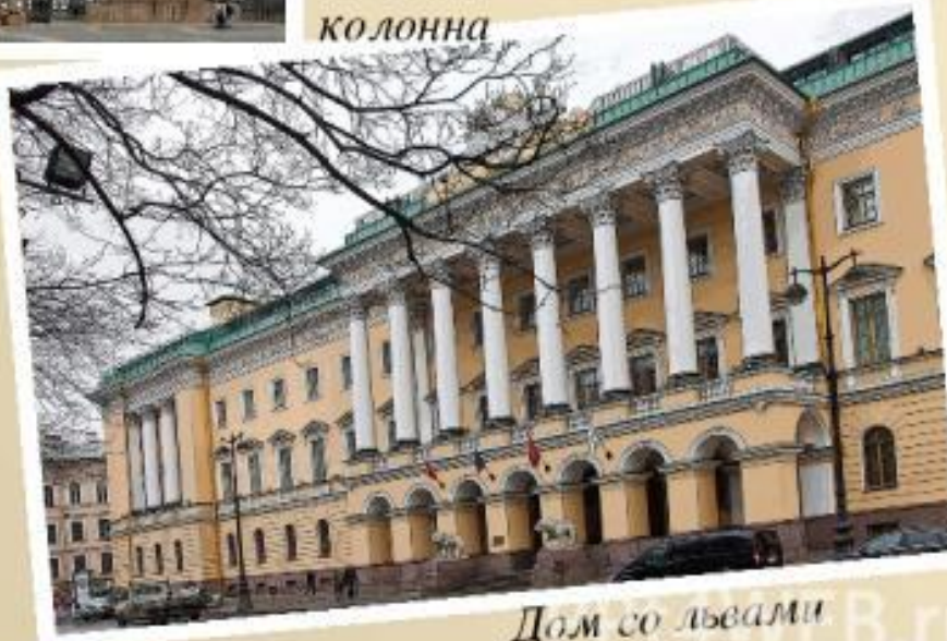
Дом со львами

Обзор жизни и творчества великого архитектора к 240-летию со дня рождения