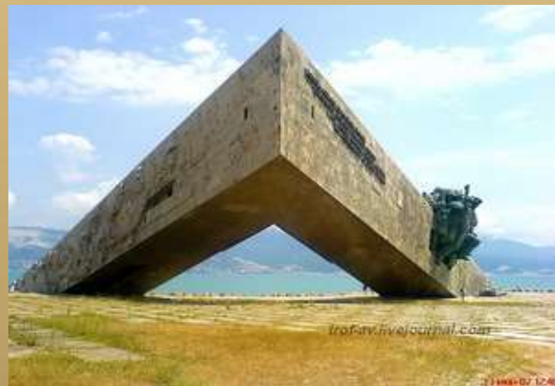
мемориал «Малая земля»