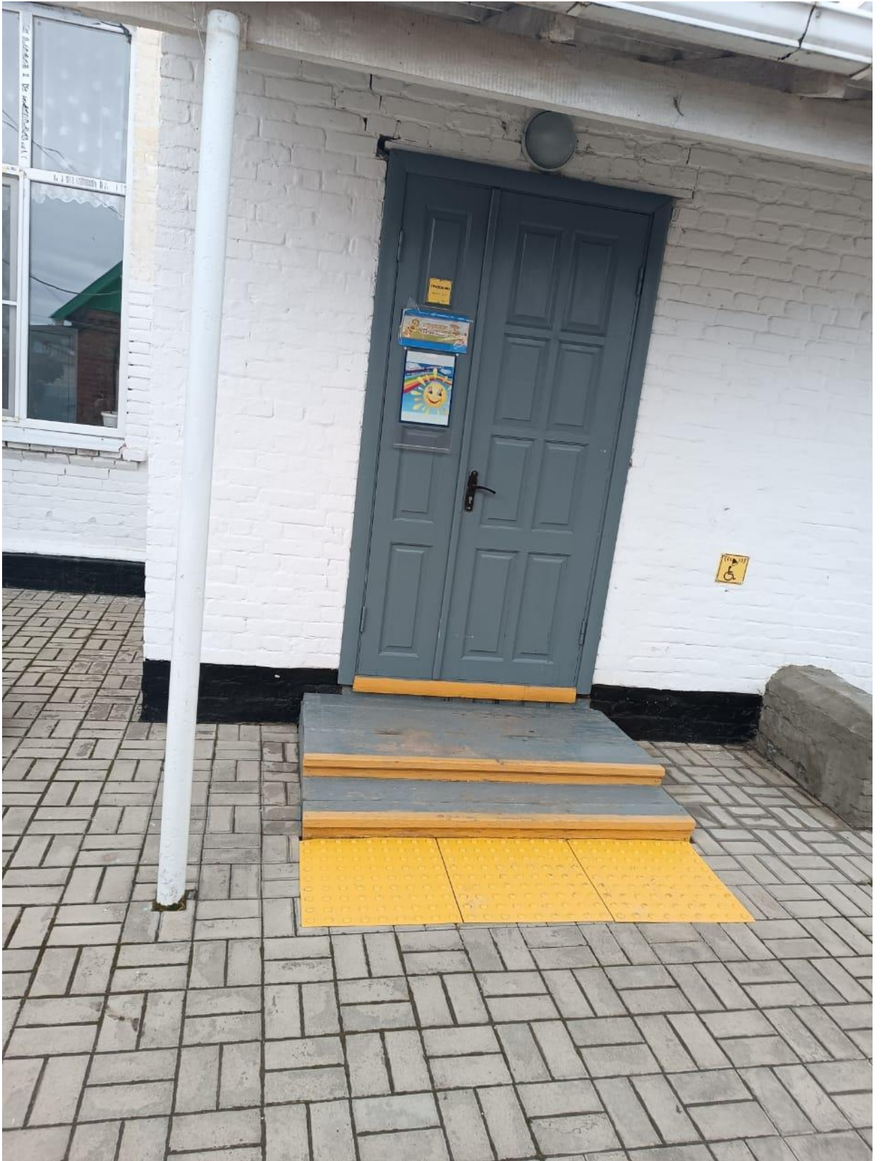
ВХОД 3 ГРУППА (МЛАДШЕ-СРЕДНЯЯ)