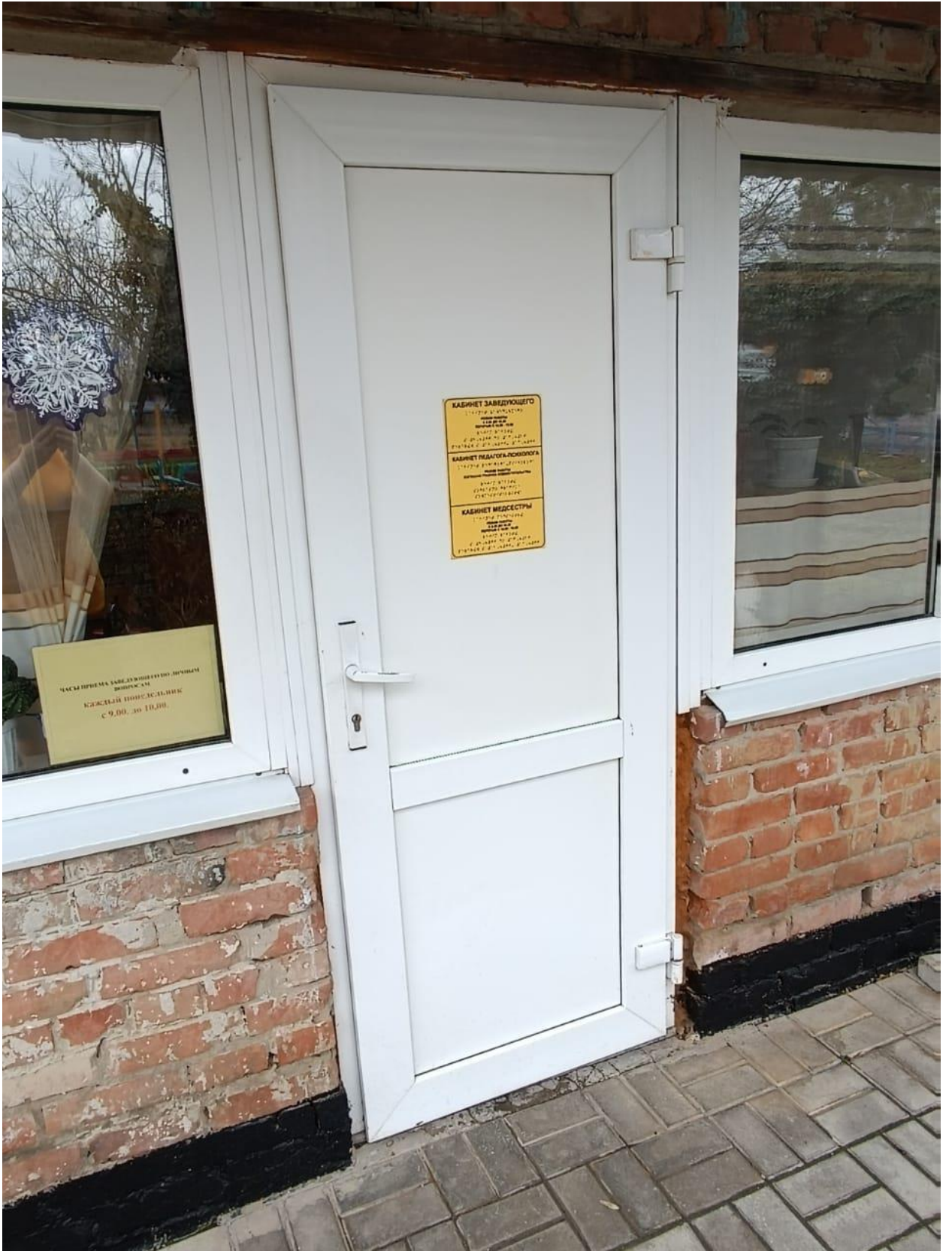
ВХОД В КАБИНЕТ ЗАВЕДУЩЕГО