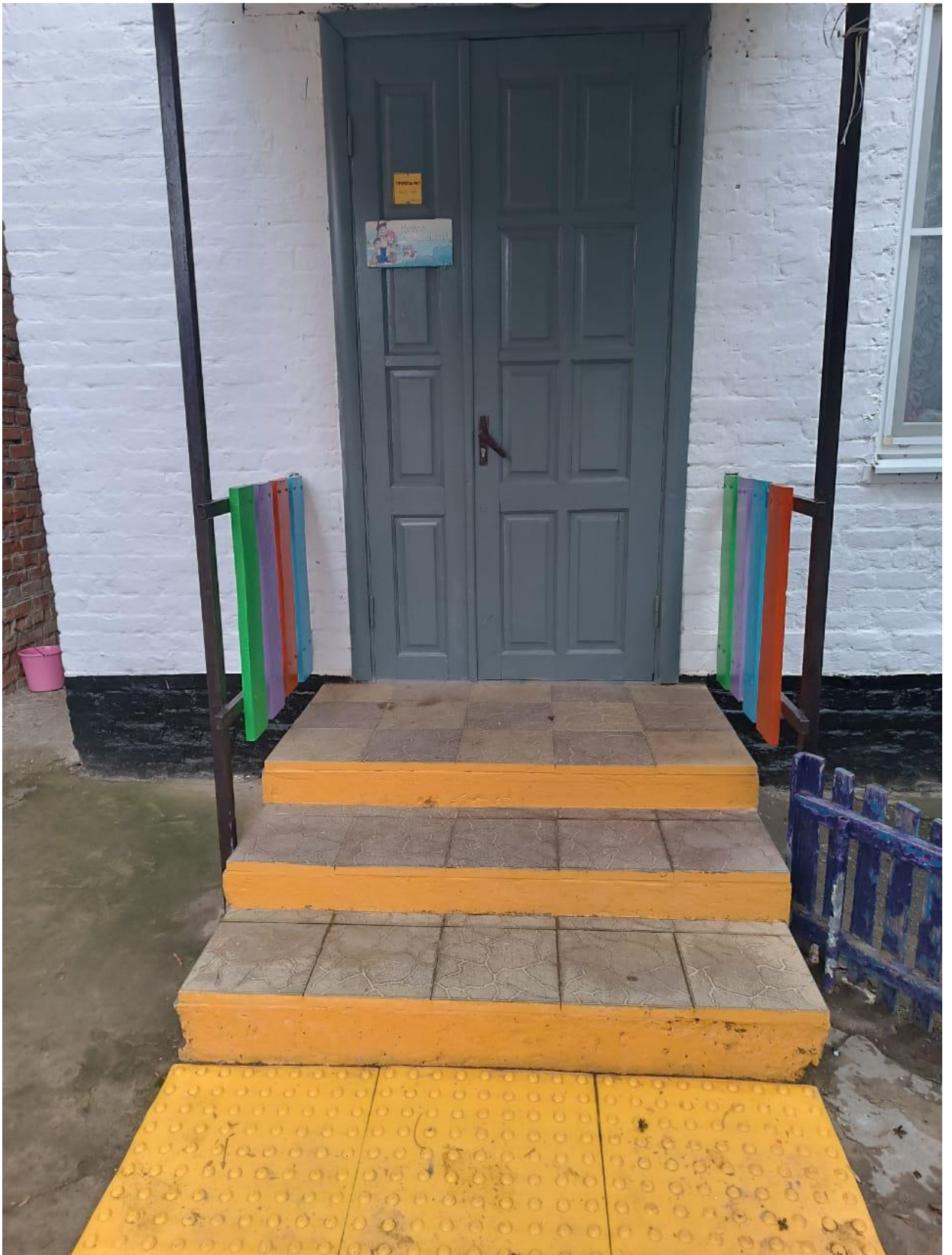
ВХОД 1 ГРУППА (1 ГРУППА РАНЕГО ВОЗРАСТА-2 ГРУППА РАННЕГО ВОЗРАСТА)