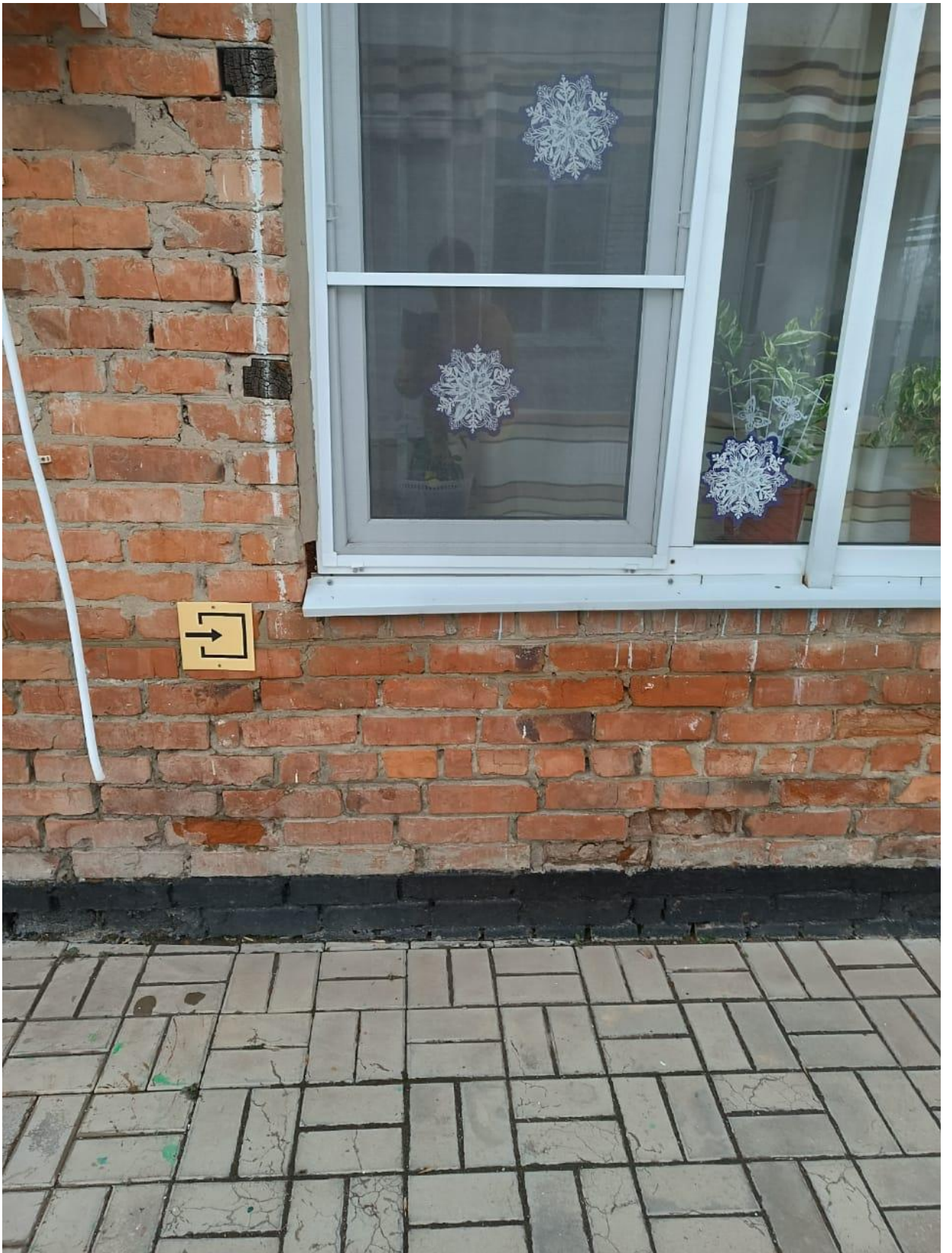
УКАЗАТЕЛЬ НАПРАВЛЕНИЯ К КАБИНЕТУ ЗАВЕДУЮЩЕГО, ПИЩЕБЛОКУ