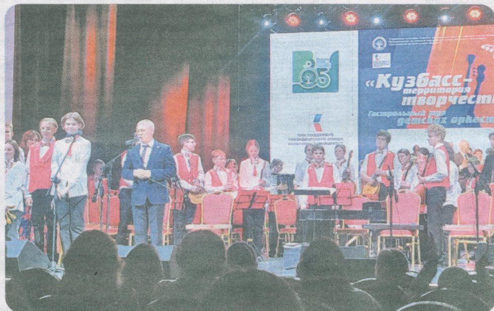
Оркестр русских народных инструментов ЦДМШ №1