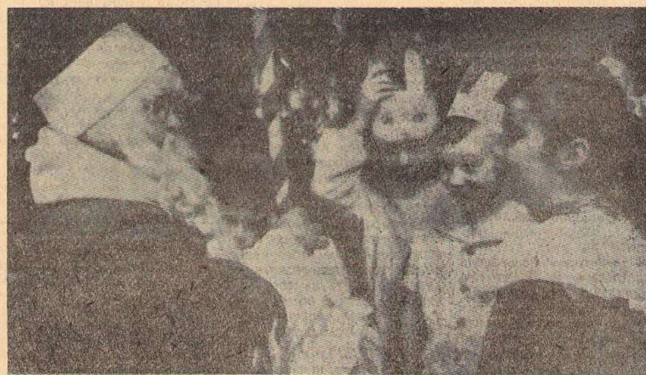
ЕЛКА В РАЙОННОМ ДОМЕ КУЛЬТУРЫ.