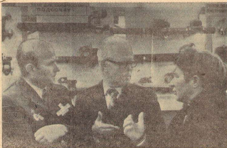
ВСЕСОЮЗНОЕ СОВЕЩАНИЕ НА ИНСТРУМЕНТАЛЬНОМ

завершить выполнение годового плана досрочно, к 29 декабря 1975 года; выработать сверхплана 10 миллионов киловатт-часов электроэнергии; довести мощность второго блока станции до 200 мегаватт.