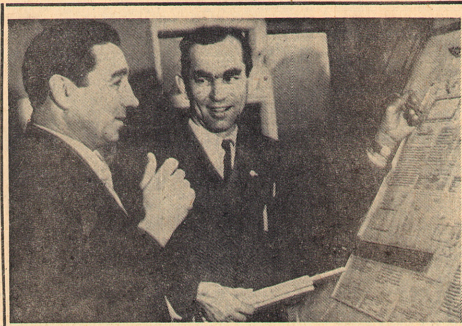
Обеспечить на основе дальнейшей реконструкции производство 20 тонн асбокартона сверх годового плана, получить 20000 рублей сверхплановой прибыли — вот рубеж, который предстоит взять в этом году коллективу фабрики имени Коминтерна.