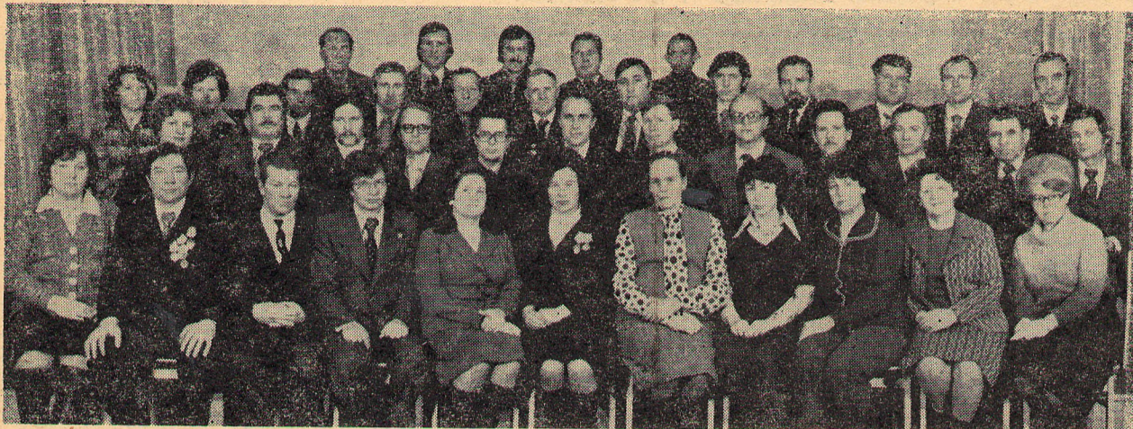
Делегация коммунистов Белоярской АЭС — самая многочисленная на конференции.

ИЗ ПОСТАНОВЛЕНИЯ XXIX ОТЧЕТНО-ВЫБОРНОЙ КОНФЕРЕНЦИИ ПАРТИЙНОЙ ОРГАНИЗАЦИИ БЕЛОЯРСКОГО РАЙОНА.