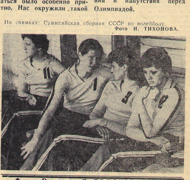
На снимках: Олимпийская сборная СССР по волейболу.