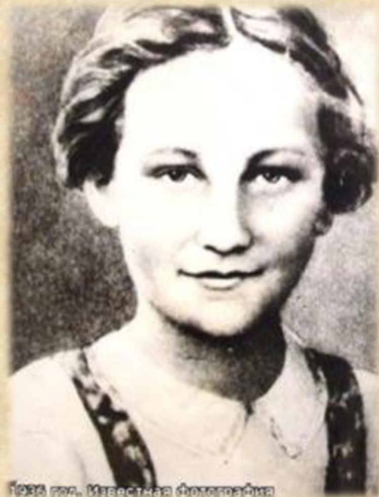
1938 год. Известная фотография

Нежный рот и высокие брови — Восемнадцать девчоночьих лет. В партизанских лесах Подмосковья Никогда не исчезнет твой след. Олененок с большими глазами, Смуглых щек полудетский овал... Посылал командир на задание — Оказалось, в Бессмертье послал. Ты попаласть гестаповцам в лапы, В беспощадные клещи беды, И палач раскаленную лампу Подносил тебе вместо воды. И тебя сапогами топтали: — Где другие бандиты, ответь! Как зовут? Ты откуда? — Я — Таня... — Где другие? — Готовят вам смерть... И по снегу ногами босыми, Крепко сжав окровавленный рот, Как на трон, партизанка России На скрипящий взошла эшафот.