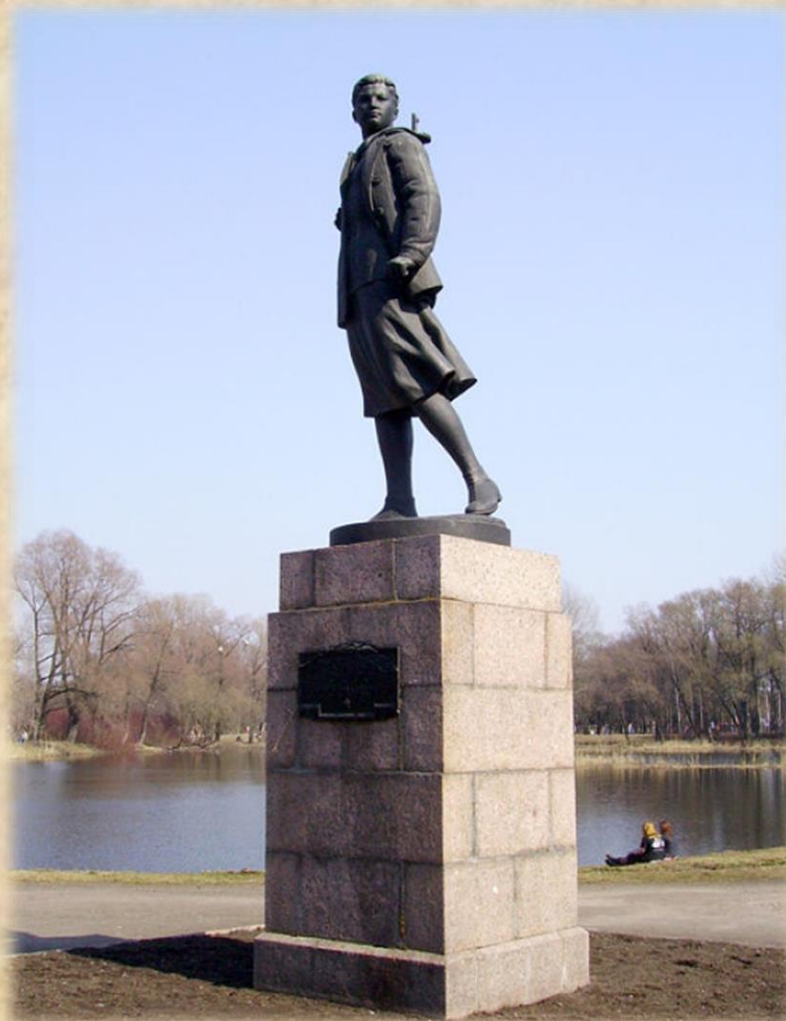
Памятник Зое Космодемьянской в Московском парке Победы в Санкт – Петербурге ( Аллея Героев)