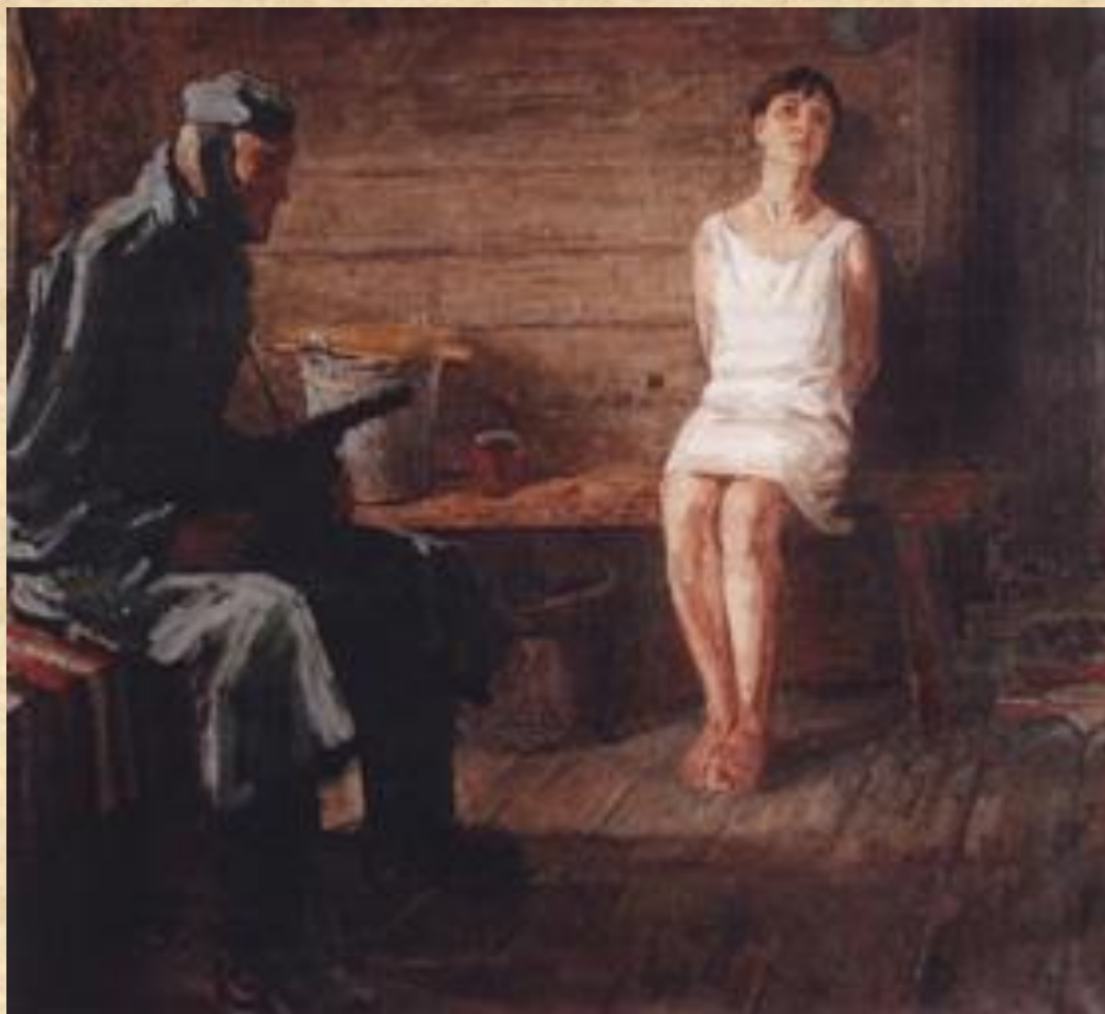
Щукин В.Г. Зоя Космодемьянская - холст, масло.