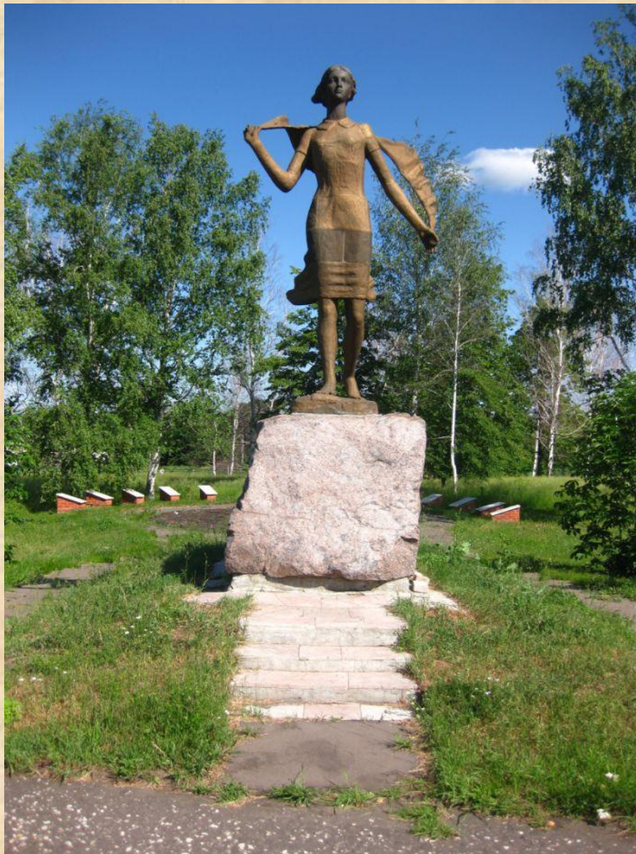
Памятник на родине, в селе Осино - Гай