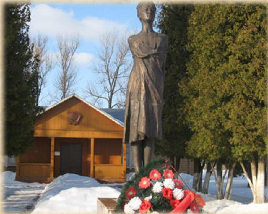
Памятник на месте казни Зои Космодемьянской в деревне Петрищево. Мемориальный музей Зои Космодемьянской.

- Граждане, не стойте, не смотрите! (Я живая, - голос мой звучит.) Убивайте их, травите, жгите! Я умру, но правда победит! Родина! - Слова звучат, как будто это вовсе не в последний раз. - Всех не перевешать, много нас! Миллионы нас!..