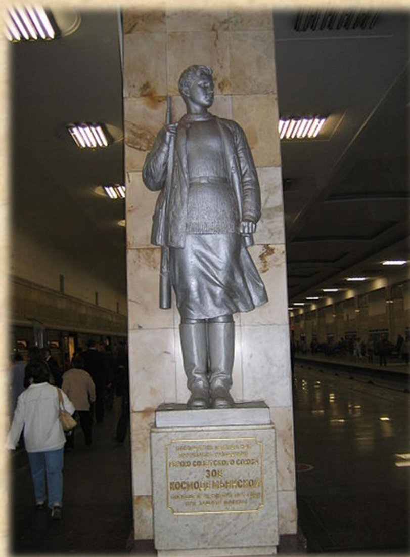
Памятник Зое Космодемьянской на станции Партизанская московского метрополитена