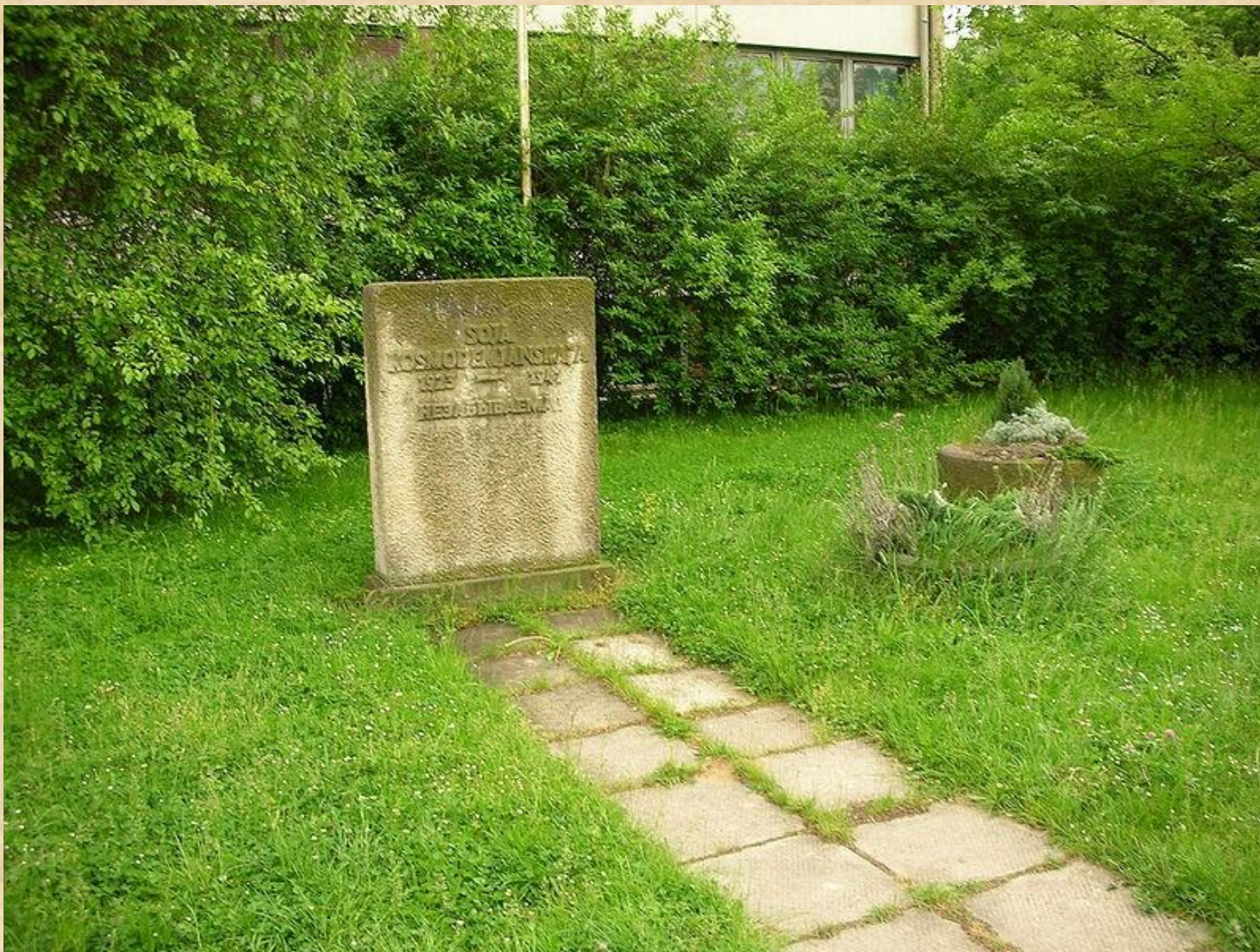
Обелиск в память Зои Космодемьянской перед 46 средней школой в г. Дрездене (Германия)