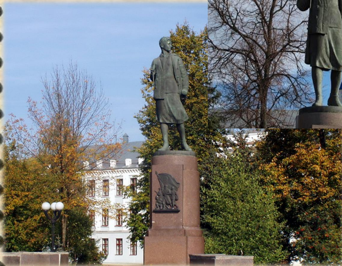
Тамбов. Памятник Зое Космодемьянской