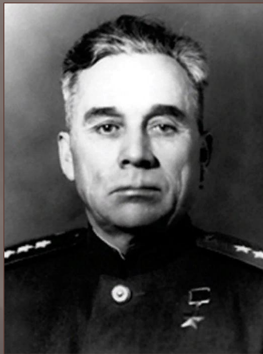
генерал Василий Гордов