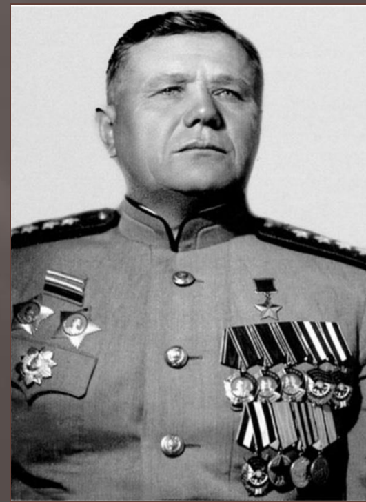
генерал Андрей Еременко