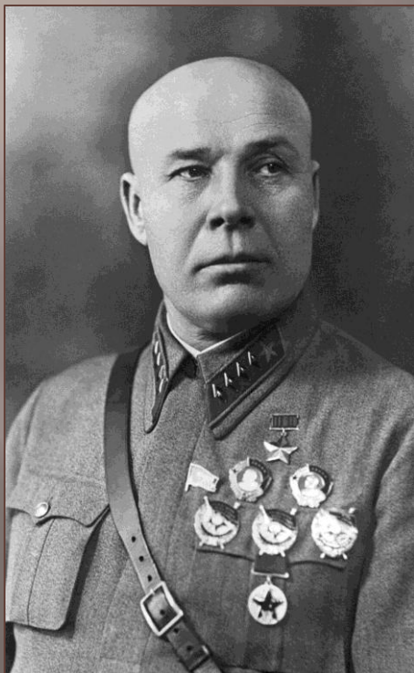
маршал Семен Тимошенко

Немцам противостояли силы Сталинградского фронта. Он был образован 12 июля и первым командующим стал бывший народный комиссар обороны – маршал Семен Тимошенко. 23 июля его сменил генерал Василий Гордов, а 13 августа на должность был назначен генерал Андрей Еременко. В состав Сталинградского фронта входили: Волжская военная флотилия, 8-ая воздушная армия и гарнизон самого города. Общая численность сил Красной армии к началу операции составляла без малого 400 тыс. солдат, 2200 орудий и минометов, 230 танков и 700 самолетов