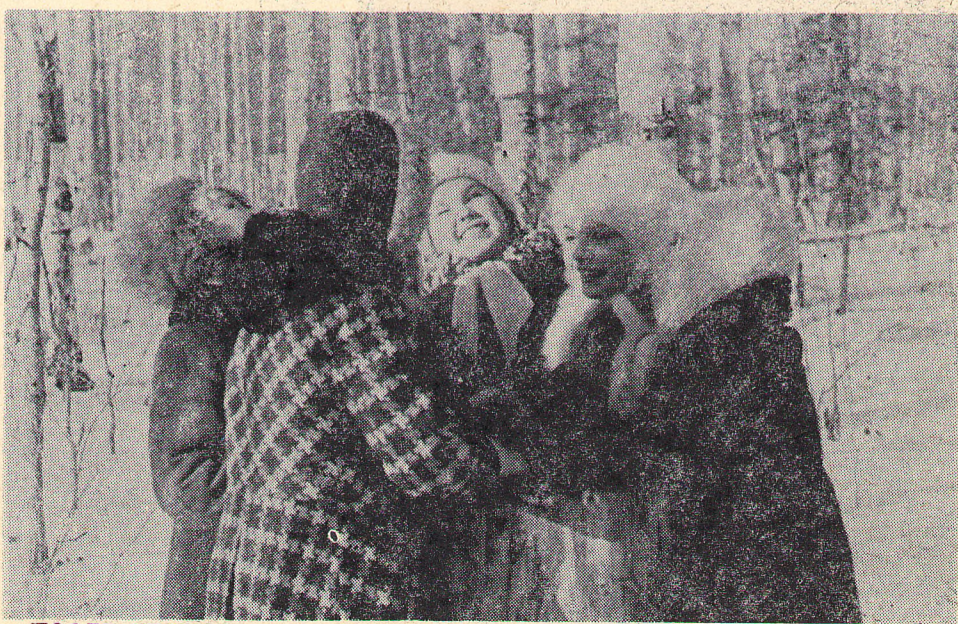
ПОСЛЕ УРОКОВ.

Занятие по теме «ЧТО ТАКОЕ СЛАЙД-ФИЛЬМ». Начало в 19 часов.